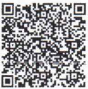
แบบรายงานฯ ป.ป.ท. รอบ ๖ เดือน/๑๒ เดือน