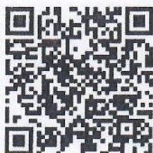
แผนปฏิบัติการป้องกันฯ