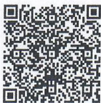
แบบรายงานแผนป้องกันฯ