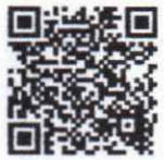
แบบตอบรับ