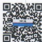
รายชื่อคู่มือ/ ชื่อหน่วยงาน/ว๒๔