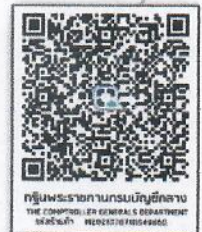
QR Code ร่วมทำบุญ

หรือสแกน QR Cord ผ่าน Application ทุกธนาคาร