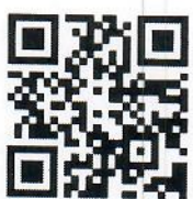
รายละเอียดโครงการ