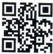
แบบฟอร์มข้อมูล

ส่วนแผนผัง (ลพบุรี) เลขที่รับ 3723 วันที่ 27 ส.ค. 2564 เวลา 15.35