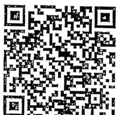
รายงานฉบับสมบูรณ์ การสำรวจและพัฒนาแหล่ง เมล็ดพันธุ์ไม้มีค่าเพื่อชุมชน