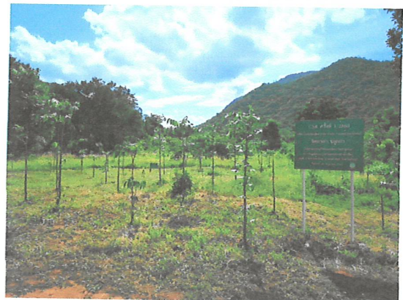
เจ้าหน้าที่ผู้รับผิดชอบกิจกรรมส่งเสริมการจัดการป่าชุมชน นำคณะเจ้าหน้าที่จากสำนักแผนงานและสารสนเทศ ลงพื้นที่ติดตามความก้าวหน้าผลการดำเนินงาน ณ ป่าชุมชนบ้านลำน้ำเขียว ตำบลเขาน้อย อำเภอลำสนธิ จังหวัดลพบุรี