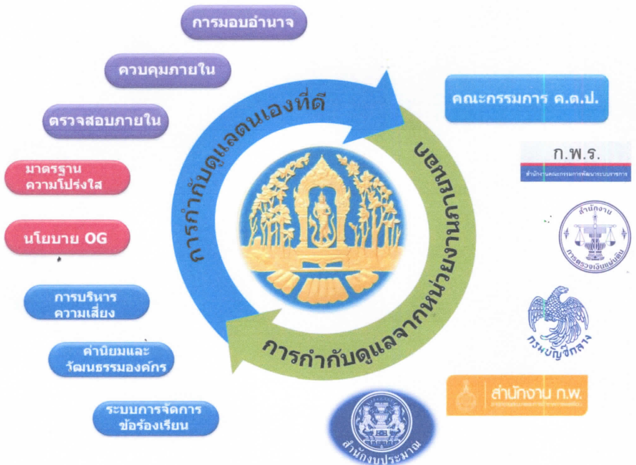
ภาพที่ 2 ระบบการกำกับดูแลองค์กรของกรมป่าไม้

(2.2) ด้านผลการดำเนินงาน เช่น สำนักงาน ก.พ.ร. และ คณะกรรมการ ค.ต.ป. เป็นต้น