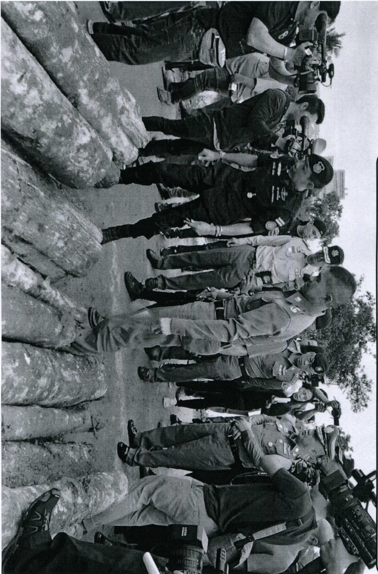
ส่วนห้องปฏิบัติการและควบคุมไฟฟ้า