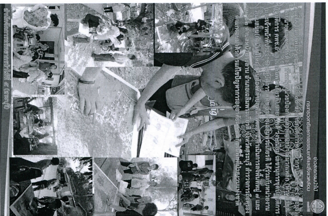
สำนักงานส่งเสริมการเกษตรอำเภอเฉลิมพระเกียรติ (สระบุรี)

ชุดปฏิบัติการ คทช. อำเภอเฉลิม พระเกียรติ ลงพื้นที่หมู่ที่ 7 และ 12 ตำบลหน้าพระลาน อำเภอเฉลิม พระเกียรติ เพื่อสำรวจข้อมูล ราษฎรที่ถือครองที่ดินในพื้นที่ป่า สงวนแห่งชาติ ตามกรอบมาตรการ แก้ไขปัญหาการอยู่อาศัยและทำ กินในพื้นที่ป่าสงวนแห่งชาติ