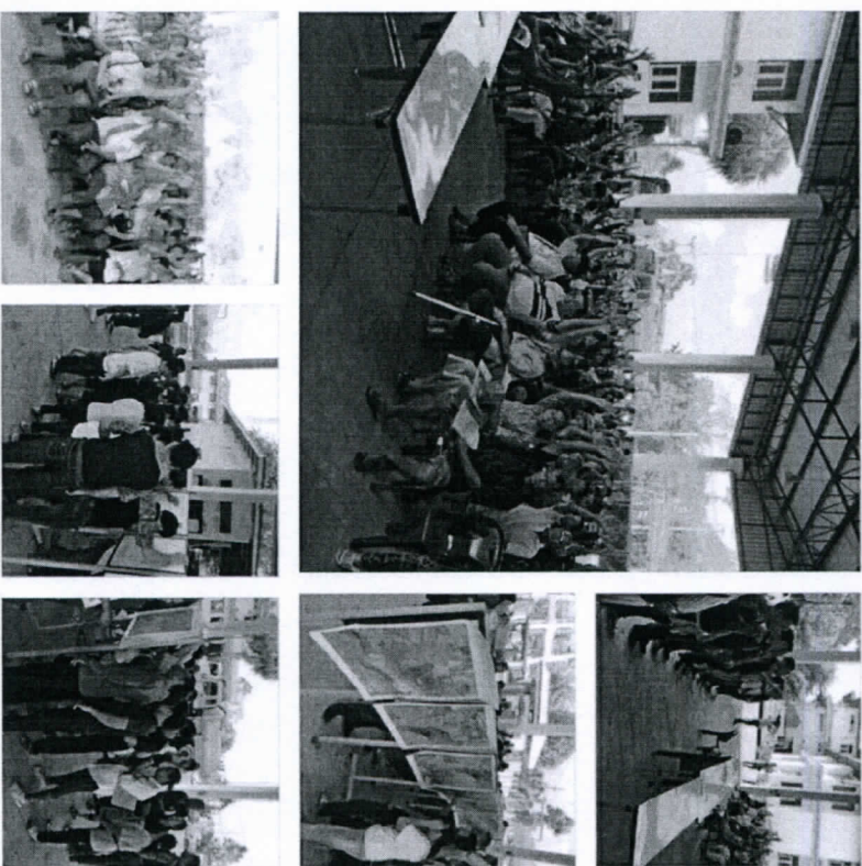
สำนักงานส่งเสริมการศึกษานอกระบบ และ成人ศึกษา (สศน.)

วันจันทร์ที่ 25 กุมภาพันธ์ 2562 เวลา 09.00 น. สำนักจัดการทรัพยากรป่าไม้ที่ 5 (สระบุรี) นำโดยหัวหน้าชุดปฏิบัติการ คทช.อำเภอเฉลิมพระเกียรติ(นายสมเดช ศรีทอง หัวหน้า หน่วยป้องกันและพัฒนายุทธศาสตร์ป่าไม้จากเหล็ก)และช่างการชุดปฏิบัติการ(นายสมเดช วงษ์นิยม) และเจ้าหน้าที่ประจำชุดปฏิบัติการ คทช.อำเภอเฉลิมพระเกียรติ ร่วมกันหน่วยงานสนับสนุน (กานัน,ผู้ใหญ่บ้านและเจ้าหน้าที่ อบค.ท้องถิ่น) จัดประชุมประชาคมราษฎรหมู่ที่ 4,5,6,7,9,11 และ12 ต.หน้าพระลาน อ.เฉลิมพระเกียรติ จ.สระบุรี เพื่อลงประชาคมตีเห็นขอปรับแผนการ จัดการทรัพยากรที่ดินและป่าไม้ระดับพื้นที่(ตำบลหน้าพระลาน อำเภอเฉลิมพระเกียรติ จังหวัดสระบุรี) ณ ที่ทำการองค์การบริหารส่วนตำบลหน้าพระลาน ตำบลหน้าพระลาน อำเภอเฉลิมพระเกียรติ จังหวัดสระบุรี