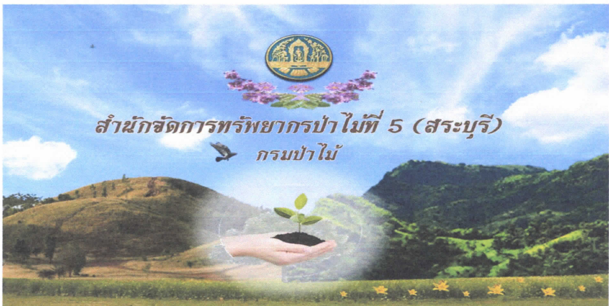
รูปแบบที่ ๑

- ประธาน หารื้อที่ประชุมเรื่อง แบบป้ายไว้นิลโลโก้สำนักจัดการทรัพยากรป่าไม้ที่ ๕ (สระบุรี) ติดบอร์ดในห้องประชุมสำนักจัดการทรัพยากรป่าไม้ที่ ๕ (สระบุรี)