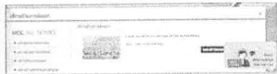
ภาพระบบ MOC e-Service