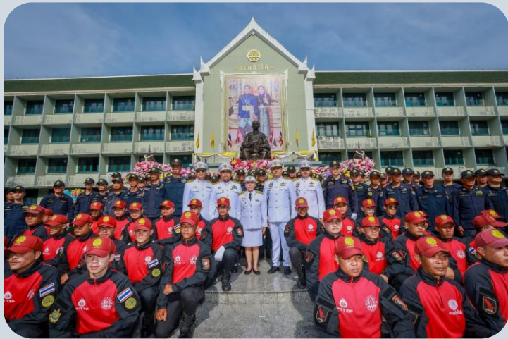
❖ ร่วมพิธีวางพวงมาลาเนื่องในวันปิยมหาราช

กิจกรรมส่งเสริมการเข้าร่วมกิจกรรมทางศาสนาที่ต้นหับถือสี่ประสานประเพณีและดำรงไว้ซึ่งวิถีวัฒนธรรมไทย เพื่อให้บุคลากรมีความกตัญญู สำนึกรู้คุณต่อแผ่นดินเกิด ธรรมชาติสิ่งแวดล้อม สถาบันองค์กร และผู้มีพระคุณ