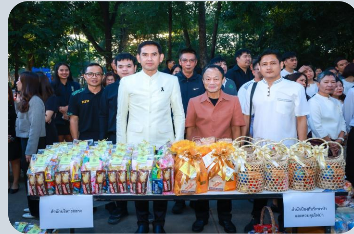
❖ ร่วมทำบุญตักบาตรเนื่องในวันขึ้นปีใหม่