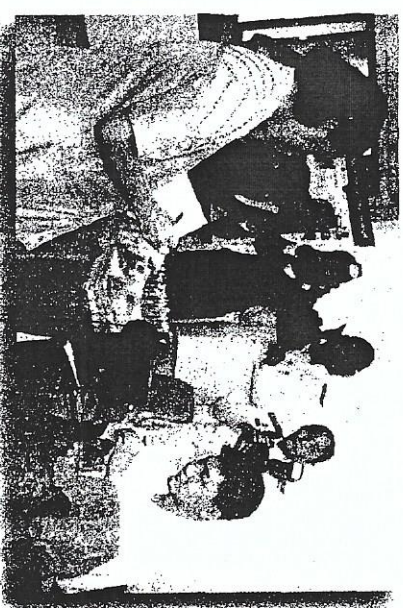
สมเด็จพระเทพรัตนราชสุดาฯ สยามบรมราชกุมารี เสด็จทอดพระเนตรศึกษา สดงามบรมราชกุมารี ด้านอาชีพคนพิการทางสติปัญญา

มูลนิธิฯ ได้ตระหนักถึงปัญหาของประชากรที่พิการทางสติปัญญาในประเทศไทย ซึ่งมีแนวโน้มจะทวีความรุนแรงและซับซ้อนมากยิ่งขึ้น ซึ่งจะเป็นปัญหาในการพัฒนาประชากรของประเทศโดยส่วนรวม มูลนิธิฯ นอกจากจะมีศูนย์ฯ ให้บริการแก่คนพิการทางสติปัญญา 10 แห่ง ครอบคลุมทุกวัยอยู่แล้ว แต่ก็กำลังวางแผนที่จะขยายทั่วประเทศ เพื่อบรรเทาปัญหาและเริ่มแรก ทั้งการกระตุ้นพัฒนาการ การศึกษาและการฝึกอาชีพ มูลนิธิฯ ได้จัดตั้งศูนย์ส่งเสริมเฉลิมพระเกียรติ 84 พรรษา พัฒนาคุณภาพชีวิตผู้พิการทางสติปัญญาแบบครบวงจร ซึ่งจะต้องใช้งบประมาณเป็นจำนวนมากในการดำเนินงาน จึงได้ร่วมกับกองทัพบกและสถานีวิทยุโทรทัศน์กองทัพบก จัดรายการพิเศษ “วันรวมใจประชา มรดกปัญญาอ่อนฯ” ในวันพฤหัสบดีที่ 12 กรกฎาคม 2561 เวลา 22.30-00.30 น. ทางสถานีวิทยุโทรทัศน์กองทัพบก หารายได้เพื่อขยายบริการให้ผู้พิการทางสติปัญญาได้มากยิ่งขึ้น ความเมตตาของท่าน จะเป็นกำลังใจสำคัญในการช่วยเหลือผู้พิการทางสติปัญญา ให้ได้รับการพัฒนาคุณภาพชีวิตที่ดีต่อไป ขอเชิญท่านผู้มีจิตกุศลได้โปรดร่วมบริจาคเงินสมทบทุนช่วยเหลือคนพิการทางสติปัญญาครั้งนี้ด้วย