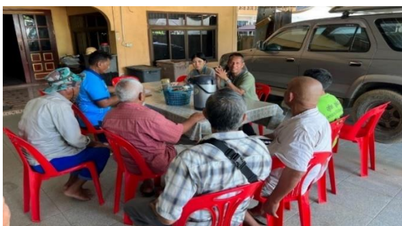
เจ้าหน้าที่ส่วนจัดการป่าชุมชน ให้คำแนะนำ สร้างความรู้ความเข้าใจ และเป็นທີ່ปรึกษาให้ป่าชุมชนเป้าหมาย จัดทำแบบแผนกิจกรรมบริหารจัดการป่าชุมชน เพื่อพัฒนาคุณภาพชีวิต (อน.บ.1) ให้แก่ป่าชุมชนบ้านคลองยางแดง หมู่ที่ 4 ตำบลท่าชะมวง อำเภอรัตภูมิ จังหวัดสงขลา