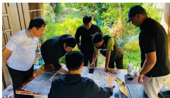
ชี้แจงการดำเนินงานภายใต้แผนการจัดการทรัพยากรที่ดิน และป่าไม้ระดับพื้นที่ ให้กับคณะกรรมการหมู่บ้าน ในเขตป่าสงวนแห่งชาติ ป่าแม่ยม ท้องที่ บ้านน้ำแ่ง ตำบลขุนควร อำเภอปง จังหวัดพะเยา