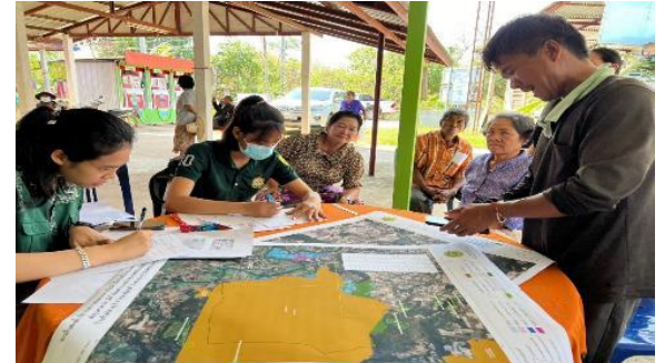
คัดกรองคุณสมบัติของราษฎร ท้องที่ หมู่บ้านบ้านห้วยไฮ หมู่ที่ 3 ตำบลห้วยไธ้ อำเภอนองบัวระเหว จังหวัดชัยภูมิ