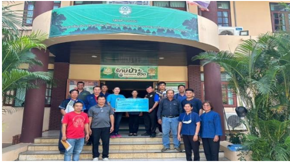
ป่าชุมชนเป้าหมายท้องที่ จังหวัดแพร่ รับมอบเช็คเงินอุดหนุน ณ สำนักจัดการทรัพยากรป่าไม้ที่ 3 สาขาแพร่