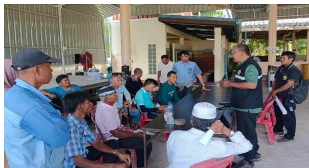
ประชุมชี้แจงเพื่อทำความเข้าใจแก่ราษฎร ณ บ้านโละคูหยง หมู่ที่ 5 ตำบลศาลาด่าน อำเภอเกาะลันตา จังหวัดกระบี่