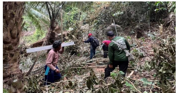
ติดตั้งหลักเขตป่าชุมชน บ้านวังศิลาติเรกสาร หมู่ที่ 3 ตำบลเพิ่มพูนทรัพย์ อำเภอบ้านนาสาร จังหวัดสุราษฎร์ธานี