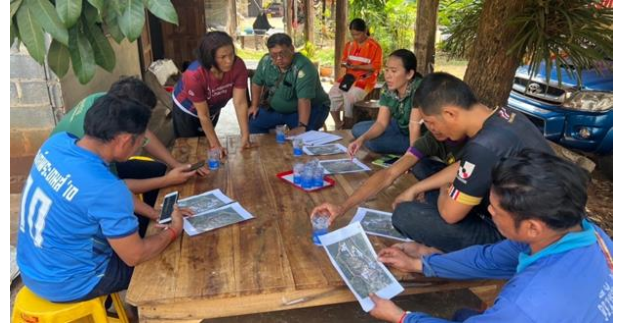
ส่งเสริมประชาสัมพันธ์การจัดตั้งป่าชุมชน บ้านทุ่งมะกอก หมู่ที่ 1 ตำบลองค์พระ อำเภอด่านช้าง จังหวัดสุพรรณบุรี