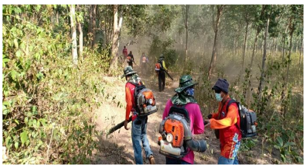
จัดทำแนวกันไฟ หมู่ที่ 19 บ้านวังกระบาก อำเภอวังทอง จังหวัดพิษณุโลก