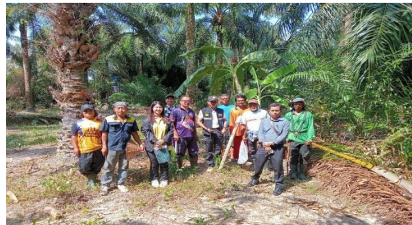
ตรวจสอบรังวัดจัดทำแผนที่ป่าชุมชน บ้านบางผึ่งน้ำพุร้อน หมู่ที่ 5 ตำบลโคกยาง อำเภอเหนือคลอง จังหวัดกระบี่