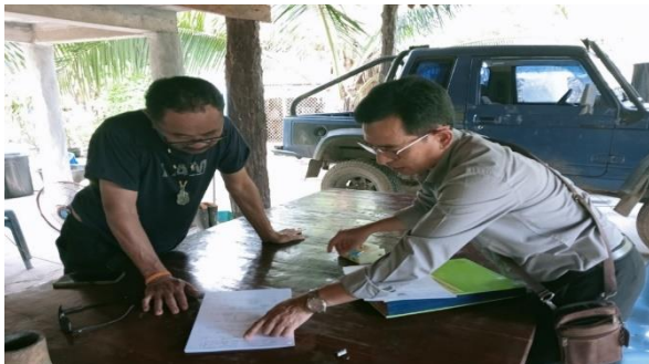
แนะนำชุมชนในการจัดทำคำขอจัดตั้งป่าชุมชน บ้านบางผึ่งน้ำพุร้อน หมู่ที่ 5 ตำบลโคกยาง อำเภอเหนือคลอง จังหวัดกระบี่