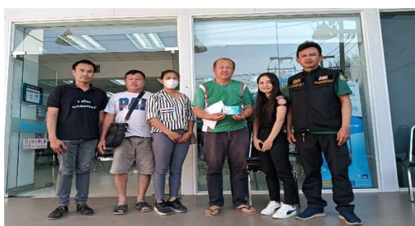
เปิดบัญชีเพื่อขอรับเงินอุดหนุนบ้านท่าปาย หมู่ที่ 3 ตำบลแม่ฮี้ อำเภอปาย จังหวัดแม่ฮ่องสอน