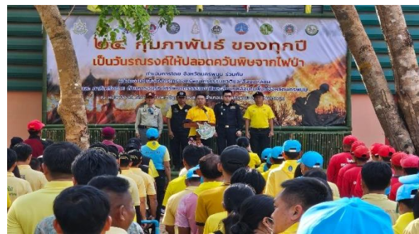
ประสานความร่วมมือกับจังหวัดนครพนม และองค์กรปกครองส่วนท้องถิ่น เตรียมความพร้อม ควบคุมไฟป่าร่วมกัน ท้องที่ บ้านกรูคู ตำบลกรูคู อำเภอเมืองนครพนม จังหวัดนครพนม