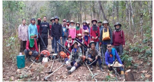
กิจกรรมการจัดทำแนวกันไฟ ตามแบบ อนุ.บ.1 ป่าชุมชนบ้านสันนาเคียน หมู่ที่ 4 ตำบลสันนาหนองใหม่ อำเภอเวียงสา จังหวัดน่าน