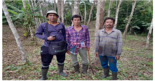
สำรวจรังวัดแปลงที่ดิน หมู่ที่ 6 ตำบลวังมะปราง อำเภอเขาวิเศษ จังหวัดตรัง