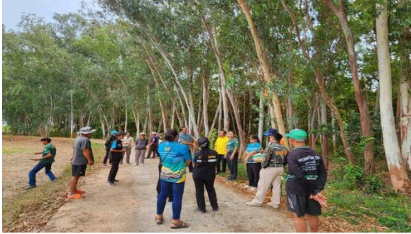
เจ้าหน้าที่ศูนย์ป่าไม้ศรีสะเกษ ออกตรวจสอบ และรังวัดพื้นที่ที่ขอจัดตั้งป่าชุมชน บ้านโนนสาวสวย หมู่ที่ 4 ตำบลบึงบูรพ์ อำเภอบึงบูรพ์ จังหวัดศรีสะเกษ