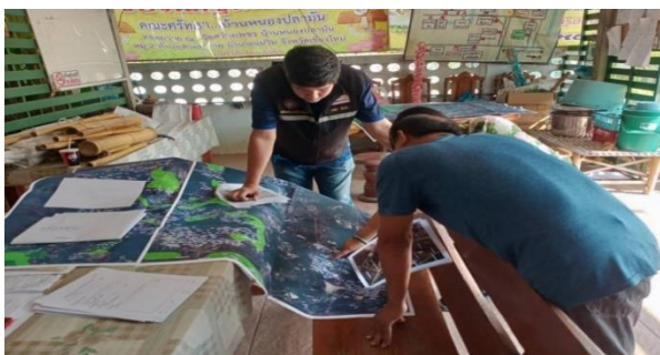
เจ้าหน้าที่จัดเตรียมข้อมูลพื้นฐาน ดำเนินการจัดทำแผนที่วางแผนกำหนดแปลงสำรวจป่าสุเทพ อำเภอเมือง จังหวัดเชียงใหม่