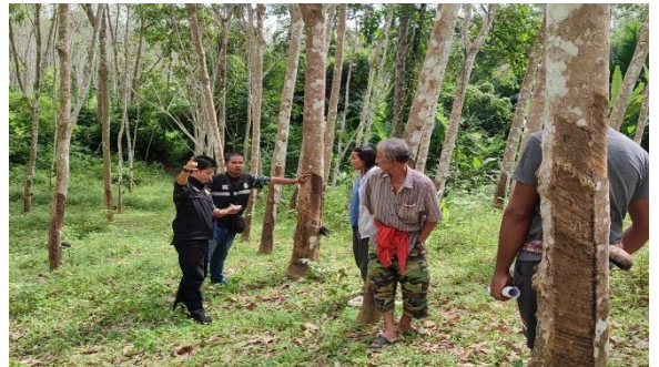
สำรวจจริงวัดแปลงที่ดินราษฎร หมู่ที่ 1 ตำบลนาชุมเห็ด อำเภอย่านตาขาว จังหวัดตรัง