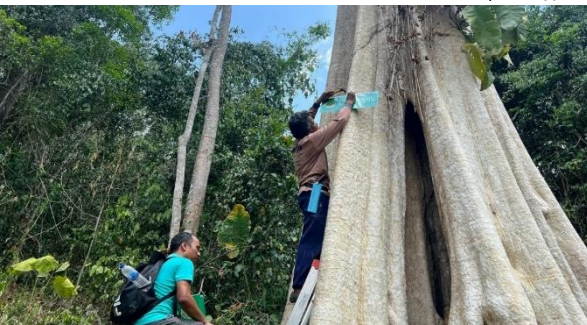
ติดตั้งป้ายแนวเขตป่าชุมชน บ้านวังศิลาติเรกสาร หมู่ที่ 3 ตำบลเพิ่มพูนทรัพย์ อำเภอบ้านนาสาร จังหวัดสุราษฎร์ธานี