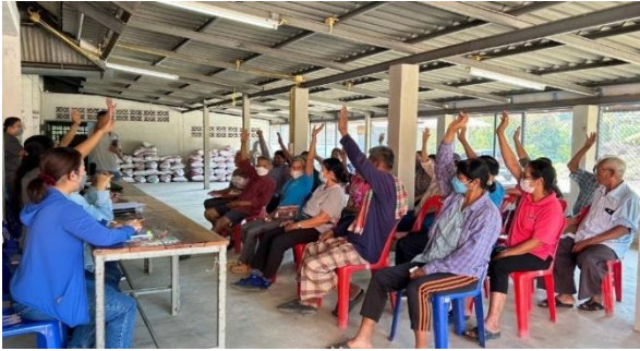
ส่งเสริมประชาสัมพันธ์การจัดตั้งป่าชุมชน บ้านเขาชะงุ้ม หมู่ที่ 6 ตำบลเขาชะงุ้ม อำเภอโพธาราม จังหวัดราชบุรี