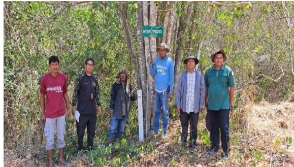
ดำเนินการปักหลักเขตป่าชุมชน และติดป้ายแนวเขตป่าชุมชนบ้านยางชุม หมู่ที่ 1 ตำบลกลัดหลวง อำเภอยายาง จังหวัดเพชรบุรี