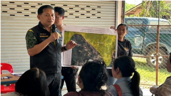
การจัดประชุมชี้แจงราษฎรสร้างการมีส่วนร่วม ก่อนเข้าปฏิบัติงานในพื้นที่ป่าไม้ถาวร ป่าปลายห้วยกระเสียว บ้านทุ่งน้อย หมู่ที่ 4 ตำบลคอกควาย และบ้านอีพุงใหญ่ หมู่ที่ 4 ตำบลเจ้าวัด อำเภอบ้านไร่ จังหวัดอุทัยธานี