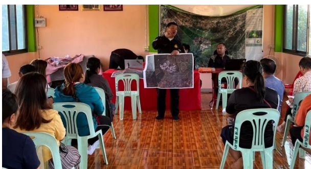
ประชุมชี้แจงการดำเนินงานภายใต้แผนการจัดการทรัพยากรที่ดิน และป่าไม้ระดับพื้นที่ให้กับราษฎร ในเขตป่าสงวนแห่งชาติ ป่าน้ำแม่คำ ป่าน้ำแม่สอง และป่าน้ำแม่จันฝั่งซ้าย ท้องที่ บ้านเล่าสับ ตำบลแม่สองนอก อำเภอแม่ฟ้าหลวง จังหวัดเชียงราย