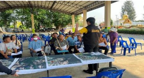
จัดประชุมราษฎร ท้องที่ หมู่บ้านบ้านห้วยเกต หมู่ที่ 2 ตำบลละตะแบก อำเภอเทพสถิต จังหวัดชัยภูมิ