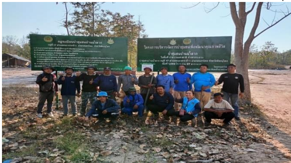
ติดตาม กำกับ ดูแล และให้คำแนะนำการดำเนินงาน ให้เป็นไปตามแบบแผนนอกกิจกรรม ฯ