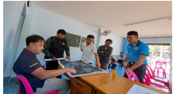
ประชุมชี้แจงราษฎรป่าไม้ถาวร ป่าสายดอนนา ท้องที่ ตำบลบางเขา อำเภอหนองจิก จังหวัดปัตตานี