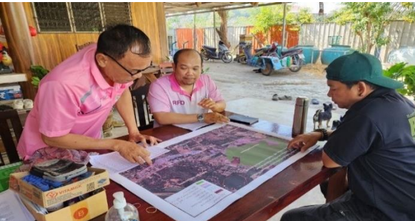
สำรวจตรวจสอบขอบเขตพื้นที่ดำเนินการ ในแต่ละกรอบมาตรการ ท้องที่ บ้านหินกอง หมู่ที่ 1 ตำบลหินกอง อำเภอเมือง จังหวัดราชบุรี