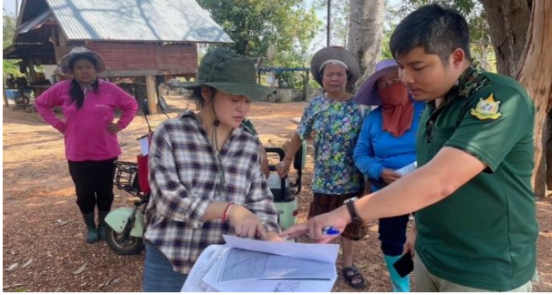
ลงพื้นที่สำรวจถือครอง บ้านแก่นเท่า หมู่ที่ 7 ตำบลบ้านฝาง อำเภอบ้านฝาง จังหวัดขอนแก่น