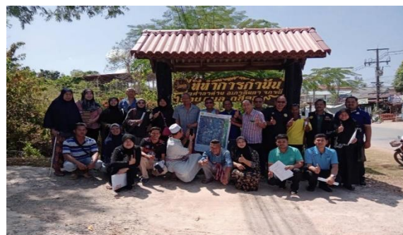
ประชุมชี้แจงเพื่อทำความเข้าใจแก่ราษฎร ณ บ้านพระแอะ หมู่ที่ 2 ตำบลศาลาด่าน อำเภอเกาะลันตา จังหวัดกระบี่