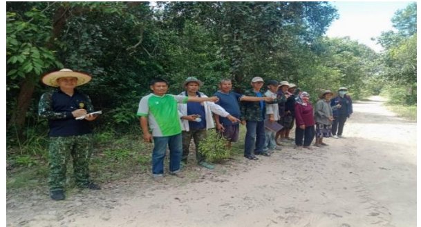
เจ้าหน้าที่ศูนย์ป่าไม้ยโสธร ออกตรวจสอบ และรังวัดพื้นที่ที่ขอจัดตั้งป่าชุมชน บ้านหนองแคน หมู่ที่ 5 ตำบลดงแคนใหญ่ อำเภอดำเนินแก้ว จังหวัดยโสธร