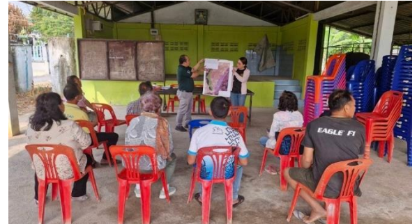
จัดประชุมชี้แจงราษฎรในพื้นที่ เพื่อทำความเข้าใจ และสร้างการมีส่วนร่วมก่อนเข้าปฏิบัติงาน ท้องที่ บ้านซำใหญ่ หมู่ที่ 3 ตำบลรางบัว อำเภอจอมบึง จังหวัดราชบุรี