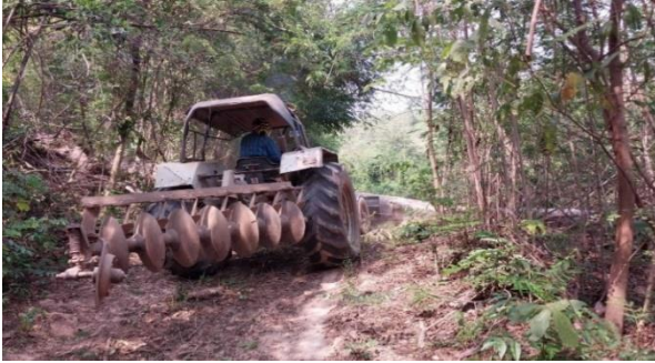
การจัดทำแนวกันไฟในพื้นที่ป่าสงวนแห่งชาติ ท้องที่ ตำบลแม่เลี้ยง อำเภอม่วงกัก จังหวัดนครสวรรค์