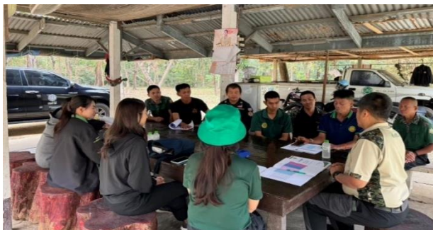
ชี้แจงแนวทางการปฏิบัติงานตามแผนงาน ท้องที่ อำเภอคลองหาด จังหวัดสระแก้ว