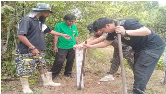
ติดตั้งหลักเขตและป้ายป่าชุมชนบ้านโคกป่าแพ่ง หมู่ที่ 7 ตำบลกบินทร์บุรี จังหวัดปราจีนบุรี