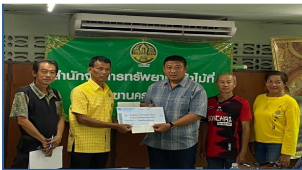
รับเงินอุดหนุนกิจกรรม ฯ ป่าชุมชนบ้านสมอทอง หมู่ที่ 2 ตำบลทองหลาง อำเภอห้วยคต จังหวัดอุทัยธานี