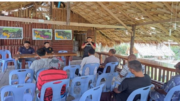
ประชุมชี้แจงสร้างการมีส่วนร่วมป่าไม้ถาวร ป่าสายโฮ ท้องที่ ตำบลท่ากำชำ อำเภอหนองจิก จังหวัดปัตตานี