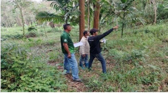
สำรวจรังวัดแปลงที่ดิน หมู่ที่ 3 ตำบลสมหวัง อำเภอท่งทราย จังหวัดพัทลุง