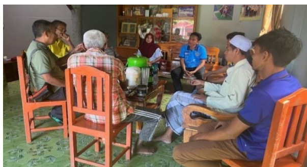
เจ้าหน้าที่ส่วนจัดการป่าชุมชน ให้คำแนะนำ สร้างความรู้ความเข้าใจ และเป็นທີ່ปรึกษาให้ป่าชุมชนเป้าหมาย จัดทำแบบแผนกิจกรรมบริหารจัดการป่าชุมชนเพื่อพัฒนาคุณภาพชีวิต (อน.บ.1) ให้แก่ป่าชุมชนบ้านหูนบ หมู่ที่ 5 ตำบลท่าชะมวง อำเภอรัตภูมิ จังหวัดสงขลา