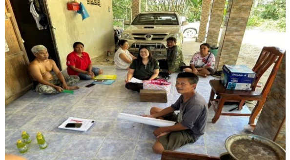
สำรวจตรวจสอบพื้นที่ดำเนินการ บ้านพรัง หมู่ที่ 3 ตำบลบางริน อำเภอเมือง จังหวัดระนอง