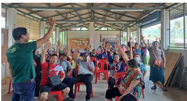
ประชุมราษฎรและคณะกรรมการหมู่บ้าน สร้างการมีส่วนร่วมในการนำมาตรการลงสู่การปฏิบัติ ท้องที่ บ้านปางไม้แดง หมู่ที่ 3 ตำบลบ้านช้าง อำเภอแม่แตง จังหวัดเชียงใหม่