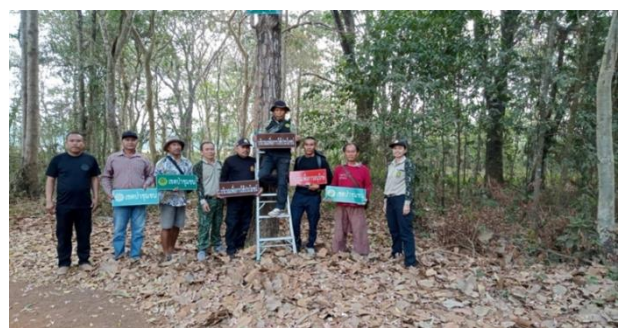
ติดตั้งหลักเขตและป้ายป่าชุมชนบ้านห้วยชัน หมู่ที่ 3 ตำบลช่องกุ่ม อำเภอดำเนินสะดวก จังหวัดสระแก้ว