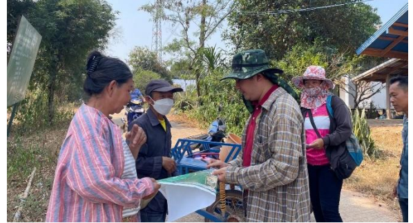
ลงพื้นที่สำรวจถือครอง บ้านคำพอก หมู่ที่ 5 ตำบลโนนยาง อำเภอนองสูง จังหวัดมุกดาหาร