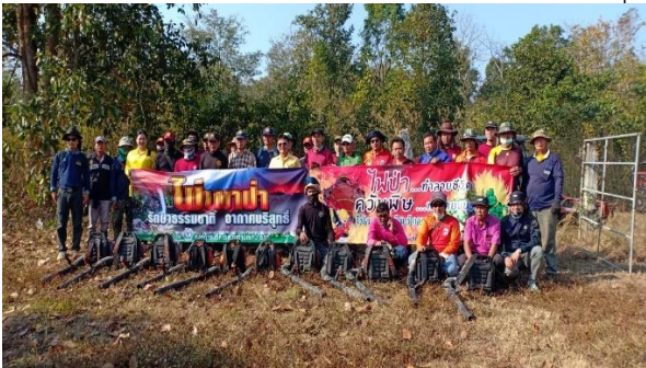
จัดทำแนวกันไฟ บ้านทรัพย์ไพรวัลย์ หมู่ที่ 7 อำเภอวังทอง จังหวัดพิษณุโลก