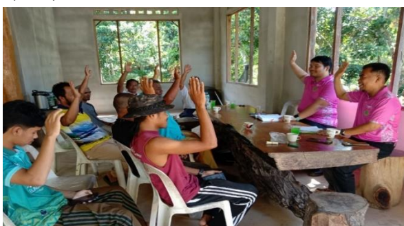
แนะนำชุมชนในการจัดทำคำขอจัดตั้งป่าชุมชน บ้านปือราปะ หมู่ที่ 7 ตำบลบันนังสตา อำเภอบันนังสตา จังหวัดยะลา