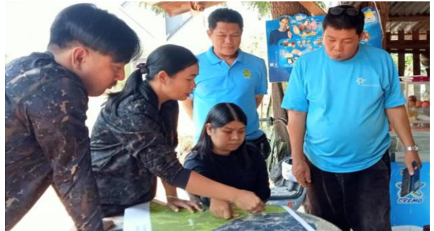
เจ้าหน้าที่จัดเตรียมข้อมูลพื้นฐาน ดำเนินการจัดทำแผนที่ วางแผนกำหนดแปลงสำรวจในพื้นที่ป่าไม้ถาวร ป่าปลายห้วยกระเสียว ร่วมกับผู้นำชุมชน บ้านอีพุงใหญ่ หมู่ที่ 4 ตำบลเจ้าวัด อำเภอบ้านไร่ จังหวัดอุทัยธานี