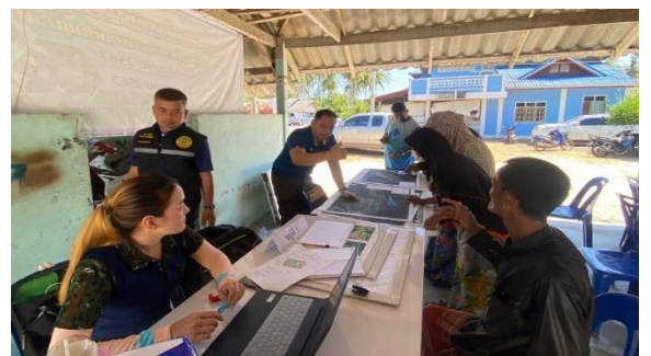
คัดกรองคุณสมบัติของราษฎร ตำบลบางเขา อำเภอหนองจิก จังหวัดปัตตานี