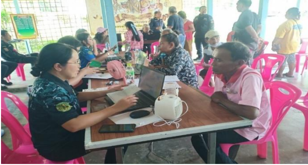
คัดกรองคุณสมบัติของราษฎร บ้านปลายคลอง หมู่ที่ 1 ตำบลน้ำจืด อำเภอกระบุรี จังหวัดระนอง