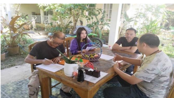
ประชาสัมพันธ์ ให้คำแนะนำ สร้างความรู้ความเข้าใจ และเป็นທີ່ปรึกษาให้ป่าชุมชนเป้าหมาย จัดทำแบบแผนกิจกรรมบ้านท่าปาย หมู่ที่ 3 ตำบลแม่ฮี้ อำเภอปาย จังหวัดแม่ฮ่องสอน