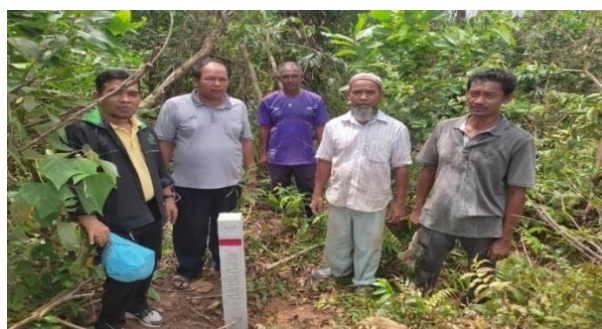
ติดตั้งหลักเขตป่าชุมชน บ้านโคกยามู หมู่ที่ 7 ตำบลไพรวัน อำเภอตากใบ จังหวัดนราธิวาส