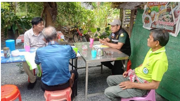
แนะนำผู้นำชุมชน และชี้แจงโครงการจัดตั้งป่าชุมชน ตามพระราชบัญญัติป่าชุมชน พ.ศ. 2562 ท้องที่ บ้านโคกยาง หมู่ที่ 10 และบ้านต้นก่อ หมู่ที่ 8 ตำบลร่อนพิบูลย์ อำเภอร่อนพิบูลย์ จังหวัดนครศรีธรรมราช