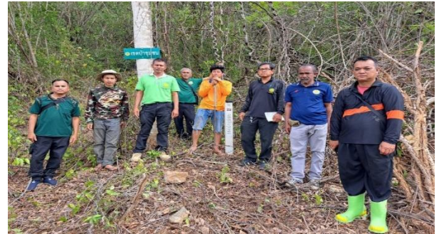
ดำเนินการปักหลักเขตป่าชุมชนและติดป้ายแนวเขตป่าชุมชน บ้านมะค่าสีช่อง หมู่ที่ 5 ตำบลหนองพลับ อำเภอหัวหิน จังหวัดประจวบคีรีขันธ์