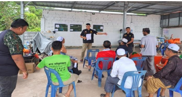
ประชุมราษฎรและคณะกรรมการหมู่บ้าน ตำบลตะโกละเมะนา อำเภอทุ่งยางแดง จังหวัดปัตตานี