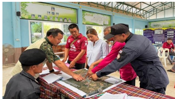
คัดกรองคุณสมบัติของราษฎร ท้องที่ อำเภอตาพระยา จังหวัดสระแก้ว