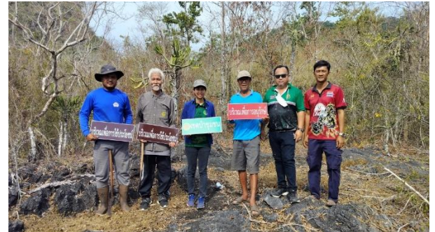
ติดตั้งป้ายเขตป่าชุมชน บริเวณเพื่อการอนุรักษ์ และบริเวณเพื่อการใช้ประโยชน์ จำนวน 60 ป้าย ณ ป่าชุมชนบ้านสีต หมู่บ้าน 3 ตำบลสีต อำเภอสีล จังหวัดนครศรีธรรมราช