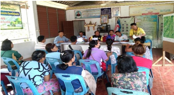
ประชุมราษฎรพร้อมทั้งคัดกรองคุณสมบัติ หมู่ที่ 10 หมู่ที่ 11 และหมู่ที่ 13 ตำบลนาท่ามเหนือ อำเภอเมือง จังหวัดตรัง