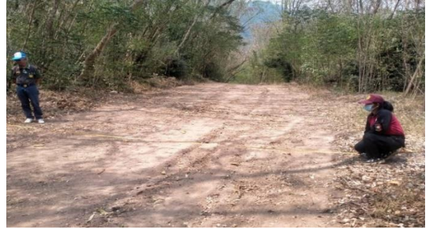
การจัดทำแนวกันไฟในพื้นที่ป่าสงวนแห่งชาติ ท้องที่ ตำบลแม่เลี้ยง อำเภอม่วงกัก จังหวัดนครสวรรค์