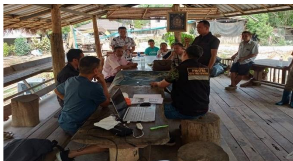
จัดประชุมชี้แจงราษฎรสร้างการมีส่วนร่วมก่อนเข้าปฏิบัติงาน ในพื้นที่ป่าสงวนแห่งชาติท้องที่ บ้านโป่งแดง หมู่ที่ 5 ตำบลทุ่งหัวช้าง อำเภอทุ่งหัวช้าง จังหวัดลำพูน