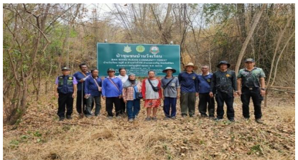
ติดตั้งป้ายป่าชุมชนบ้านวังเรียน หมู่ที่ 5 ตำบลวังจี้ใต้ อำเภอดงเจริญ จังหวัดพิจิตร