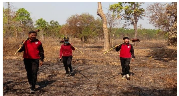
ตรวจติดตามจุดความร้อน (Hotspot) บริเวณพื้นที่เกษตรกรรม ท้องที่ บ้านวังอ้อยหนู ตำบลทุ่งแก อำเภอเจริญศิลป์ จังหวัดสกลนคร