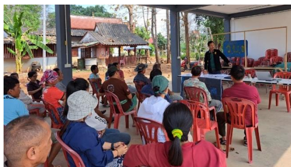
ประชุมราษฎรและคณะกรรมการหมู่บ้าน สร้างการมีส่วนร่วมในการนำมาตรการลงสู่การปฏิบัติ ท้องที่ บ้านปางไม้แดง หมู่ที่ 3 ตำบลบ้านช้าง อำเภอแม่แตง จังหวัดเชียงใหม่