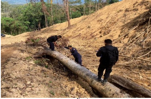
การตรวจยึดดำเนินคดี พื้นที่ป่าถูกบุกรุกแผ้วถาง ตรวจยึดไม้เหียง ไม้บ่อเลียง ในเขตพื้นที่ป่า ตามพระราชบัญญัติป่าไม้ พุทธศักราช ๒๕๘๔ บริเวณท้องที่บ้านบางลำภู หมู่ที่ ๓ ตำบลกะเปอร์ อำเภอกะเปอร์ จังหวัดระนอง พิกัด 47P 457582 E UTM 1058984 N