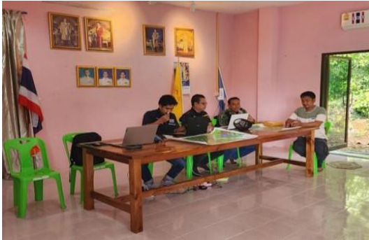
จัดเตรียมข้อมูลพื้นฐาน ดำเนินการจัดทำแผนที่วางแผน กำหนดแปลงสำรวจโดยอีตร่องรอย จากภาพถ่ายทางอากาศ เพื่อตรวจสอบความถูกต้องของพื้นที่ ในพื้นที่ป่าที่จะดำเนินการหมายเลข ๘๙ ตำบลวังใหม่ อำเภอเมืองชุมพร จังหวัดชุมพร