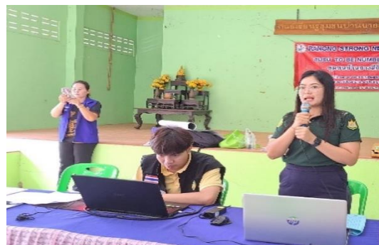
เจ้าหน้าที่พื้นที่กลุ่มที่ ๓ ประชุมชี้แจงให้ราษฎรและคณะกรรมการหมู่บ้าน รับทราบมาตรการการแก้ไขปัญหาที่ดินทำกิน ตามมติ ครม. เมื่อวันที่ ๒๖ พ.ย. ๒๕๖๑ บ้านบางสีกิม หมู่ที่ ๔ ตำบลทรายแดง อำเภอเมืองระนอง จังหวัดระนอง