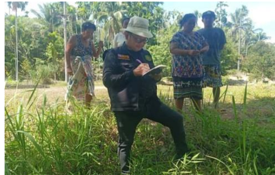
ตรวจสอบพื้นที่ ร่วมกับหน่วยป้องกันรักษาป่า โดยมีราษฎรเจ้าของพื้นที่นำตรวจสอบ ในพื้นที่ป่าที่ดินของรัฐมนตรีนอกเขตป่า (แปลง ๑) ตำบลราชกรูด อำเภอเมืองระนอง จังหวัดระนอง