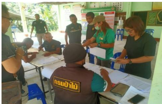
เจ้าหน้าที่คัดกรองคุณสมบัติของราษฎร ในพื้นที่กลุ่มที่ ๔ กลุ่มน้ำ ๑๒ หลังมติ ครม. ๓๐ มิ.ย. ๒๕๔๑ เพื่อรับเข้าสู่มาตรการ ตาม ครม. เมื่อวันที่ ๒๖ พ.ย. ๒๕๖๑ ณ บ้านปะติมะ หมู่ที่ ๑๔ ตำบลพะโต๊ะ อำเภอยะดี จังหวัดชุมพร