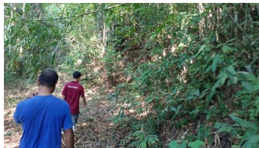
สำรวจสภาพป่าชุมชน เพื่อจัดทำแผนจัดการป่าชุมชน และจัดทำข้อบังคับเกี่ยวกับการจัดการป่าชุมชน บ้านบางแก่นจันทร์ หมู่ที่ ๒ ตำบลน้ำจืด อำเภอกระบุรี จังหวัดระนอง