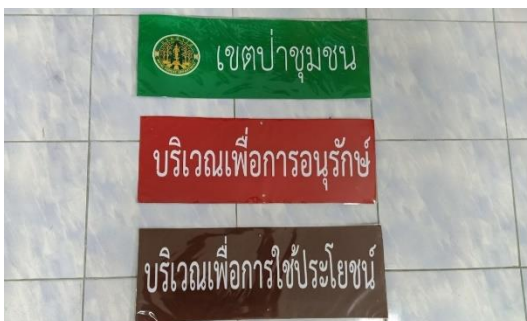
จัดทำป้ายป่าชุมชน จำนวน ๒๗๐ ป้าย