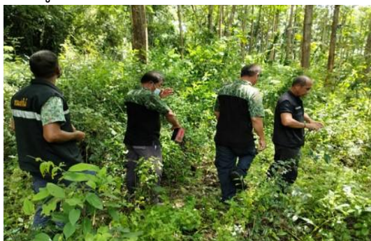
ลาดตระเวนพื้นที่ป่าสงวนแห่งชาติ ป่าชัยคราม และป่าวัดประดู่ ท้องที่บ้านน้ำฉา หมู่ที่ ๑๐ ตำบลท่าอุแท อำเภอกาญจนดิษฐ์ จังหวัดสุราษฎร์ธานี พิกัด 47 P 568462 E 1006009 N

๖.๑) รูปภาพประกอบการดำเนินงานของหน่วยปฏิบัติ