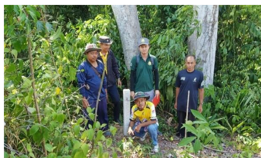
ติดตั้งหลักเขตป่าชุมชน บ้านวังศิลาดีเรกสาร หมู่ที่ ๓ ตำบลเพิ่มพูนทรัพย์ อำเภอบ้านนาสาร จังหวัดสุราษฎร์ธานี