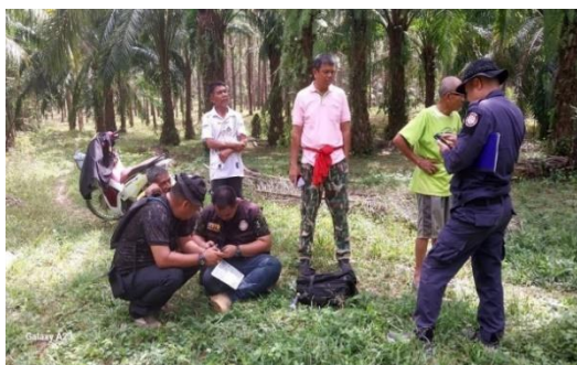
เจ้าหน้าที่พื้นที่กลุ่มที่ ๓ ร่วมกับเจ้าหน้าที่หน่วยป้องกันรักษาป่า ตรวจสอบตรวจสอบขอบเขตพื้นที่และการใช้ประโยชน์ของราษฎร ที่ยังไม่ได้รับการสำรวจมาจำแนกลงสู่กลุ่มมาตรการ เพื่อนำสู่การปฏิบัติในแต่ละมาตรการ ตามมติ ครม. เมื่อวันที่ ๒๖ พ.ย. ๒๕๖๑ ในพื้นที่บ้านเขาหยวก หมู่ที่ ๓ ตำบลราชกรูด อำเภอเมืองระนอง จังหวัดระนอง