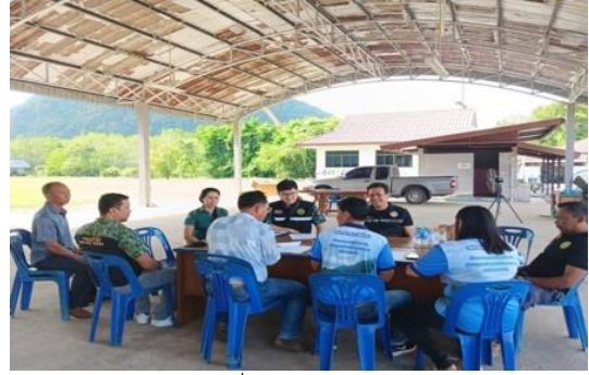
ประสานงานเพื่อสนับสนุนข้อมูลข่าวและ บูรณาการร่วมกับองค์การบริหารส่วนตำบลย่านยาว และเผยแพร่ประชาสัมพันธ์ให้ประชาชนมีความรู้ ความเข้าใจในการอนุรักษ์ทรัพยากรป่าไม้ ท้องที่บ้านหาดกรวด หมู่ที่ ๑๐ ตำบลย่านยาว อำเภอคีรีรัฐนิคม จังหวัดสุราษฎร์ธานี พิกัด 47 P 496280 E 996543 N