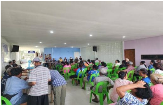
ประชุมชี้แจงราษฎรในพื้นที่ป่าไม้ถาวร ป่าที่จะดำเนินการหมายเลข ๘๙ ตำบลวังใหม่ อำเภอเมืองชุมพร จังหวัดชุมพร