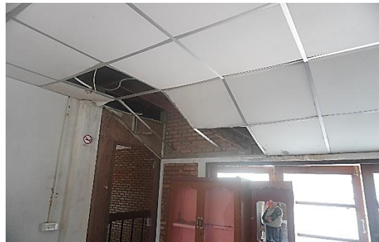
ลงพื้นที่ ณ หน่วยป้องกันรักษาป่าที่ สฎ. ๑๒ (ท่าขนอน) ตำบลน้ำหัก อำเภอคีรีรัฐนิคม จังหวัดสุราษฎร์ธานี