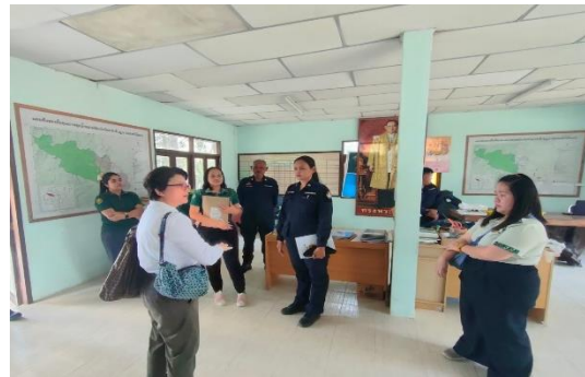
หน่วยป้องกันรักษาป่าที่ สฎ. ๖ (คลองท่าไม้แดง) ตำบลตะกุกเหนือ อำเภอิวภาวดี จังหวัดสุราษฎร์ธานี