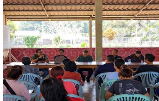
ประชุมชี้แจงราษฎรในพื้นที่ป่าไม้ถาวร ป่าที่จะดำเนินการหมายเลข ๙๒ ตำบลเขาพัง อำเภอบ้านตาขุน จังหวัดสุราษฎร์ธานี