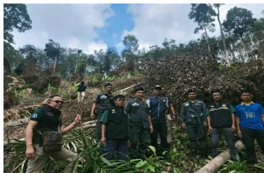
การตรวจยึดดำเนินคดี พื้นที่ป่าถูกบุกรุกแผ้วถาง ในเขตพื้นที่ป่าตามพระราชบัญญัติป่าไม้ พุทธศักราช ๒๕๕๔ บริเวณท้องที่บ้านเขาช่องแบก หมู่ที่ ๗ ตำบลพระรักษ์ อำเภอพะโต๊ะ จังหวัดชุมพร พิกัด 47P 490341 E UTM 1093014 N