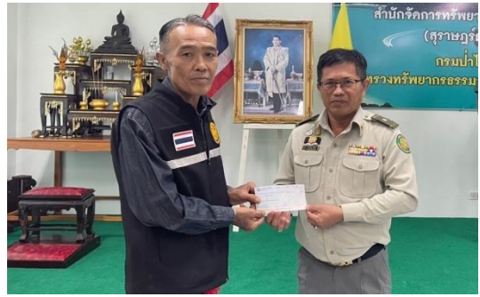
ป่าชุมชนบ้านนางแก้ว หมู่ที่ ๕ ตำบลบ้านยาง อำเภอคีรีรัฐนิคม จังหวัดสุราษฎร์ธานี รับเช็คเงินอุดหนุน ณ สำนักจัดการทรัพยากรป่าไม้ที่ ๑๑ (สุราษฎร์ธานี) วันที่ ๑๓ มีนาคม ๒๕๖๗