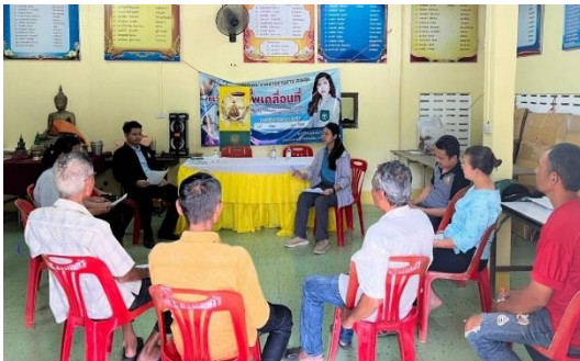
เจ้าหน้าที่ส่วนจัดการประชุมชน ให้คำแนะนำและสร้างความรู้ความเข้าใจกิจกรรมบริหารจัดการประชุมชนเพื่อพัฒนาคุณภาพชีวิตแก่คณะกรรมการประชุมชนบ้านนางแก้ว หมู่ที่ ๕ ตำบลบ้านยาง อำเภอศีร์ษะรินทร์ จังหวัดสุราษฎร์ธานี