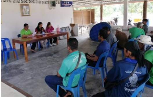
เจ้าหน้าที่ศูนย์ป่าไม้ชุมพร ประชุมคณะกรรมการจัดการป่าชุมชนและสมาชิกป่าชุมชน เพื่อจัดทำโครงการฯ กิจกรรมบริหารจัดการป่าชุมชนเพื่อพัฒนาคุณภาพชีวิต ณ ป่าชุมชนบ้านห้วยคล้า หมู่ที่ ๑๒ ตำบลตะโก อำเภอทุ่งตะโก จังหวัดชุมพร