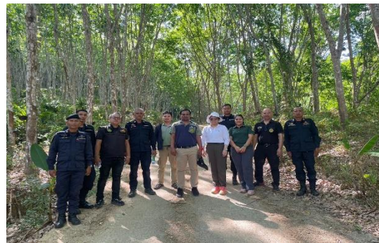
ลงพื้นที่ ณ ป่าที่จะดำเนินการหมายเลข ๙๒ ตำบลตะกุกเหนือ อำเภอิวาวดี จังหวัดสุราษฎร์ธานี