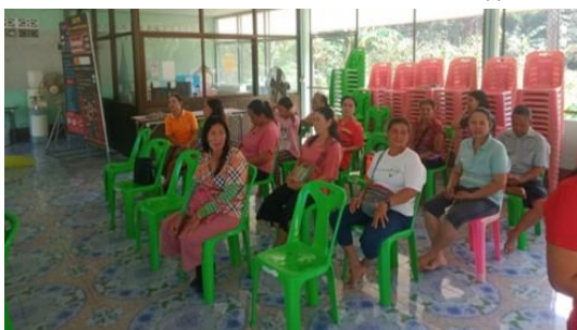
แนะนำชุมชนในการจัดทำคำขอจัดตั้งป่าชุมชน บ้านบางแก่นจันทร์ หมู่ที่ ๒ ตำบลน้ำจืด อำเภอกระบุรี จังหวัดระนอง