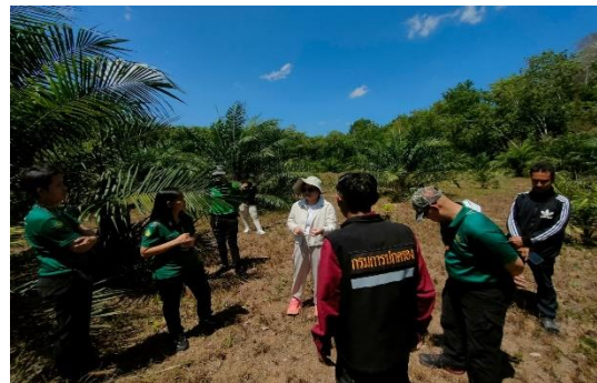
ลงพื้นที่ ณ ป่าชุมชนบ้านนางแก้ว หมู่ที่ ๕ ตำบลบ้านยาง อำเภอคีรีรัฐนิคม จังหวัดสุราษฎร์ธานี