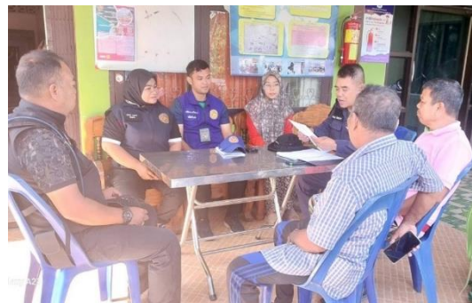
เจ้าหน้าที่คัดกรองคุณสมบัติของราษฎร ในพื้นที่กลุ่มที่ ๓ กลุ่มน้ำ ๑๒ ก่อนมติ ครม. ๓๐ มิ.ย. ๒๕๔๑ กรณีเปลี่ยนมือ เพื่อรับเข้าสู่มาตรการ ตามมติ ครม. เมื่อวันที่ ๒๖ พ.ย. ๒๕๖๑ ณ บ้านทะเลนอก หมู่ที่ ๑ ตำบลกำพวน อำเภอสุขสำราญ จังหวัดระนอง