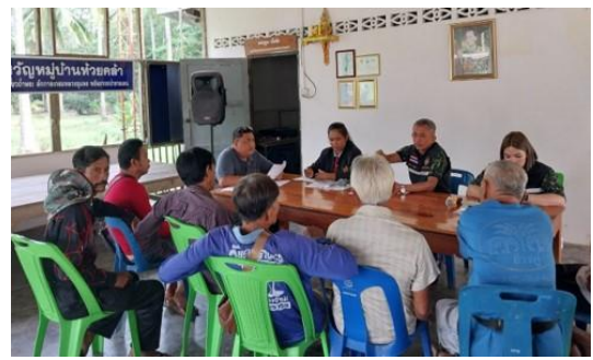
เจ้าหน้าที่ศูนย์ป่าไม้ชุมพร ประชุมคณะกรรมการจัดการประชุมชน เพื่อวางแผนจัดทำโครงการฯ กิจกรรมบริหารจัดการประชุมชนเพื่อพัฒนาคุณภาพชีวิต ณ ป่าชุมชนบ้านห้วยคล้า หมู่ที่ ๑๒ ตำบลตะโก อำเภอกุ่งตะโก จังหวัดชุมพร