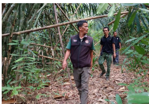
ออกตรวจลาดตระเวน วันที่ ๑๙ เมษายน ๒๕๖๖ บริเวณป่าสงวนแห่งชาติ ป่าช่องศิลาและป่าช่องชี้แรด หมู่ที่ ๒ ตำบลทรายขาว อำเภอคลองท่อม จังหวัดกระบี่