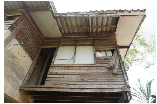
อาคารบ้านพักเจ้าหน้าที่ของหน่วยป้องกันรักษาป่าที่ กบ.๑ (เหนือคลอง)