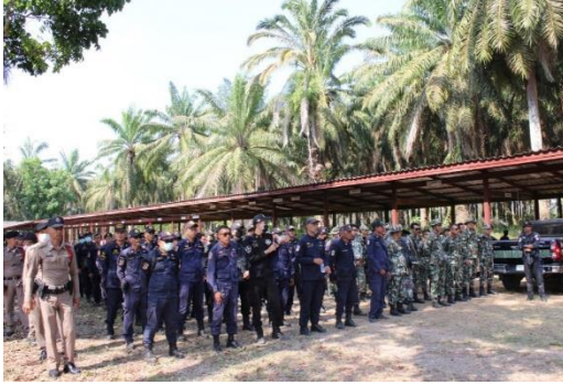
ปล่อยแถวเข้าควบคุมพื้นที่ดำเนินการรื้อถอน ท้องที่ตำบลปลายพระยา อำเภอปลายพระยา จังหวัดกระบี่