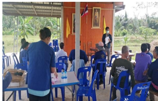
ออกประชาสัมพันธ์รับเกษตรกรเข้าร่วมโครงการ ท้องที่ตำบลทุ่งไทรทอง อำเภอลำทับ จังหวัดกระบี่