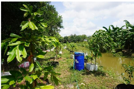
พื้นที่ของเกษตรกรที่ปลูกไม้เศรษฐกิจ