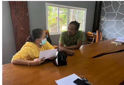
ออกประชาสัมพันธ์และรับเกษตรกรเข้าร่วมโครงการ ฯ บ้านในสระ อำเภอเมือง จังหวัดกระบี่