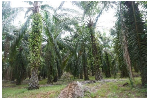
พื้นที่ดำเนินการรื้อถอนทำลายต้นปาล์มน้ำมัน ฯ