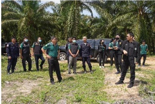
ลงพื้นที่ติดตามความก้าวหน้าผลการดำเนินงานโครงการ การรื้อถอนทำลายต้นปาล์มน้ำมัน ฯ ณ ป่าสงวนแห่งชาติป่าปลายคลองพระยา ตำบลปลายพระยา อำเภอปลายพระยา จังหวัดกระบี่