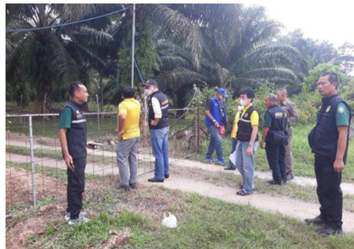
ร่วมตรวจสอบพื้นที่ เมื่อวันที่ ๓๐ ม.ค. ๒๕๖๖ ที่สาธารณะประโยชน์ทุ่งหนองเปิดน้ำ หมู่ที่ ๙ ตำบลคลองท่อมใต้ อำเภอคลองท่อม จังหวัดกระบี่