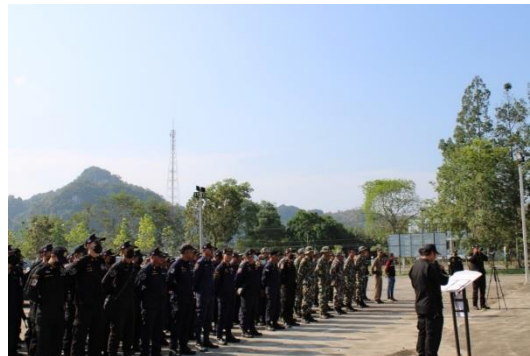
วันที่ ๑๖ มีนาคม ๒๕๖๖ เปิดยุทธการสนธิกำลังดำเนินการรื้อถอนทำลายต้นปาล์มน้ำมัน ที่ว่าการอำเภอปลายกระยา จังหวัดกระบี่