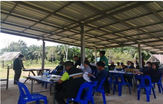
ออกประชาสัมพันธ์รับเกษตรกรเข้าร่วมโครงการ ท้องที่ตำบลทุ่งไทรทอง อำเภอลำทับ จังหวัดกระบี่