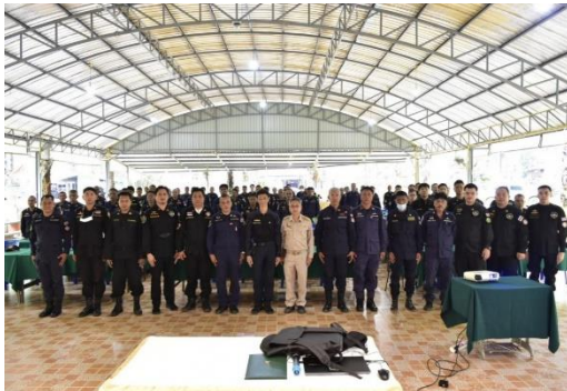
วันที่ ๑๕ มีนาคม ๒๕๖๖ เจ้าหน้าที่ร่วมประชุมวางแผนดำเนินการรื้อถอนทำลายต้นปาล์มน้ำมัน

๕.๑) รูปภาพประกอบการดำเนินงานของหน่วยปฏิบัติ