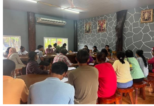
ออกประชาสัมพันธ์และรับเกษตรกรเข้าร่วมโครงการ ฯ บ้านในสระ อำเภอเมือง จังหวัดกระบี่