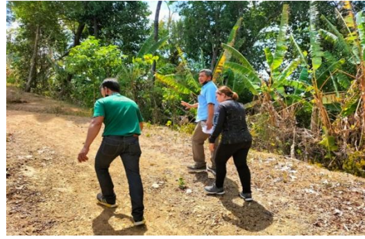
รับสมัครเกษตรกรเข้าร่วมโครงการ ท้องที่อำเภอกะปง จังหวัดพังงา