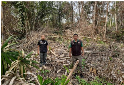
ตรวจยึดพื้นที่ ๑ แปลง ตามพระราชบัญญัติป่าไม้ พุทธศักราช ๒๔๘๔ วันที่ ๒๐ เมษายน ๒๕๖๖ เนื้อที่ ๔-๓-๒๖ ไร่ บริเวณท้องที่ ตำบลคลองท่อมเหนือ อำเภอคลองท่อม จังหวัดกระบี่