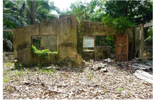
อาคารสำนักงานเก่า