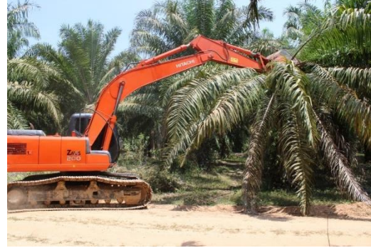
ผู้รับจ้างนำเครื่องจักรเข้ารื้อถอนทำลายต้นปาล์มน้ำมัน ท้องที่ตำบลปลายพระยา อำเภอปลายพระยา จังหวัดกระบี่