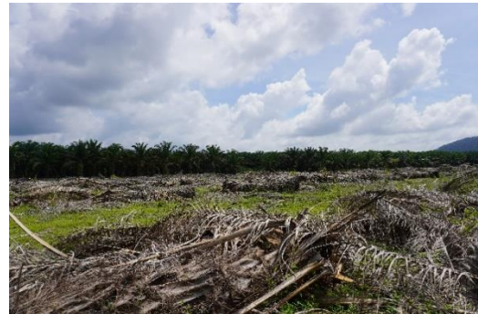
พื้นที่ดำเนินการรื้อถอนทำลายต้นปาล์มน้ำมัน ฯ