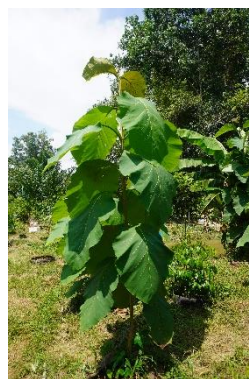
พื้นที่ของเกษตรกรที่ปลูกไม้เศรษฐกิจ