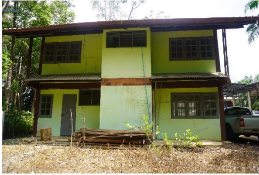
บ้านพักเจ้าหน้าที่ของหน่วยป้องกันรักษาป่าที่ กบ.๒ (คลองท่อม)