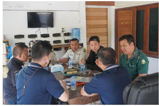
เจ้าหน้าที่สำนักแผน ๓ ประชุมร่วมกับเจ้าหน้าที่หน่วยป้องกันรักษาป่าที่ กบ.๑ (เหนือคลอง)