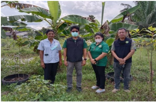
รับสมัครเกษตรกรเข้าร่วมโครงการ ท้องที่หมู่ที่ ๓ ตำบลลำทับ อำเภอลำทับ จังหวัดกระบี่