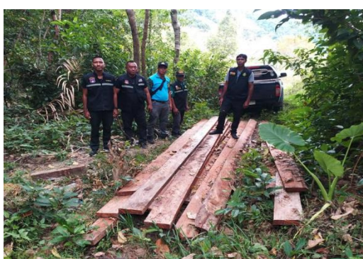
ตรวจยึดไม้แปรรูป บริเวณป่าตามพระราชบัญญัติป่าไม้ พุทธศักราช ๒๔๘๔ ท้องที่หมู่ที่ ๕ บ้านคลองจาก ตำบลเกาะลันตาใหญ่ อำเภอเกาะลันตา จังหวัดกระบี่ ตาม ปจว.๑ เวลา ๑๖.๐๐ น. คดีที่ -/๒๕๖๖ ยึดทรัพย์ที่ ๑๑/๒๕๖๖ ลงวันที่ ๖ กุมภาพันธ์ ๒๕๖๖