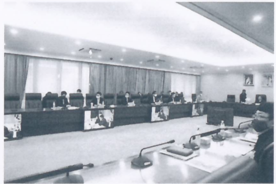
การชี้แจงอนุบัญญัติ