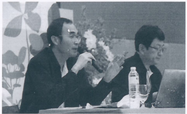
คลินิกป่าชุมชน ให้แนะนำและคำปรึกษากฎหมายป่าชุมชน