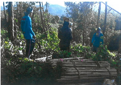
การปักหลักหมายแนวปลูก