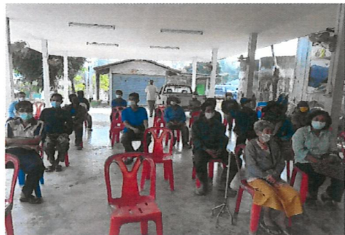
เจ้าหน้าที่ร่วมประชุมชี้แจงกับราษฎรเป็นรายหมู่บ้านเป้าหมาย เกี่ยวกับมาตรการแก้ไขปัญหาที่ดินป่าไม้ในเขตป่าสงวนแห่งชาติ