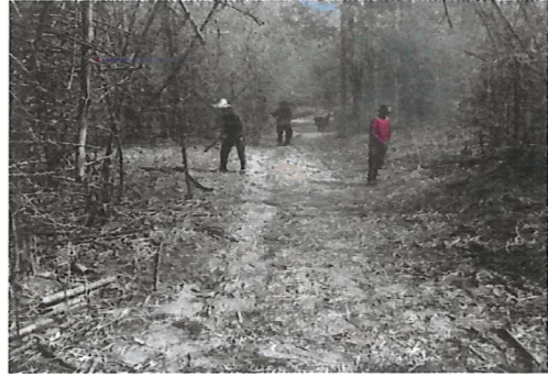
ทำแนวกันไฟ