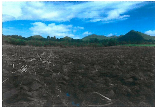
เตรียมพื้นที่เพื่อปักหลักและปลูก