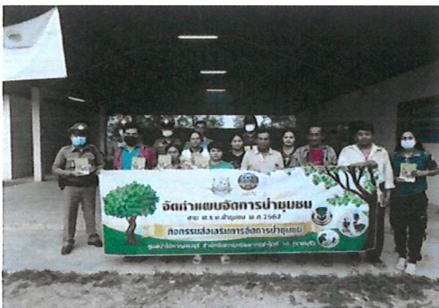
การจัดทำแผนจัดการป่าชุมชน