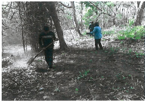
การทำแนวกันไฟ