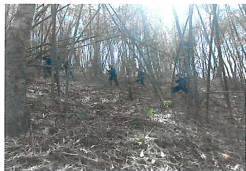
ทำแนวกันไฟ