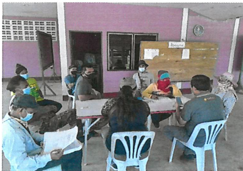
ประชุมเพื่อให้ชุมชนยื่นคำขอจัดตั้งป่าชุมชน