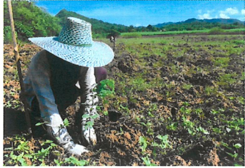
ปลูกและขนกล้าไม้