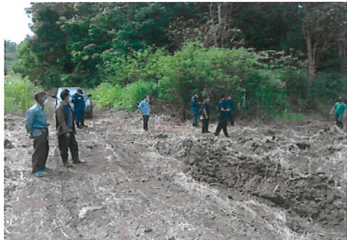
ตรวจสอบพื้นที่ร่องเรียนบริเวณบ้านถ้ำมาวังจันทร์ หมู่ที่ ๑๘ ตำบลหุ้มร้าง อำเภอบ่อพลอย จังหวัดกาญจนบุรี