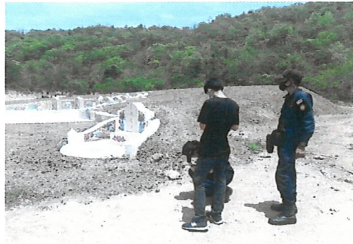
ตรวจสอบพื้นที่ตรวจยึด บริเวณสุสาน ในเขตชลประทานขออนุญาต ท้องที่ บ้านห้วยศาลา หมู่ที่ ๗ ตำบลยางหัก อำเภอบางน้ำเปรี้ยว จังหวัดราชบุรี