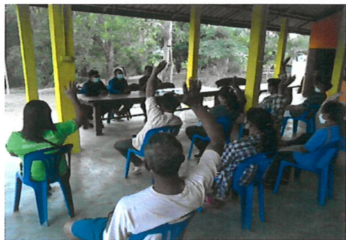
ประชุมและประชาคมจัดตั้งหมู่บ้านเครือข่ายความร่วมมือในการป้องกันและควบคุมไฟป่า