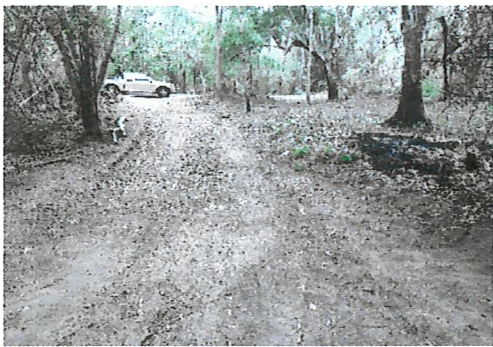
การทำทางตรวจการ