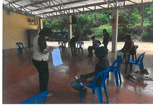
เข้าปฏิบัติงานตรวจสอบทบทวนข้อมูลการถือครองที่ดิน ในพื้นที่บ้านสะพานลาว บ้านห้วยสมจิต อำเภอทองผาภูมิ จังหวัดกาญจนบุรี