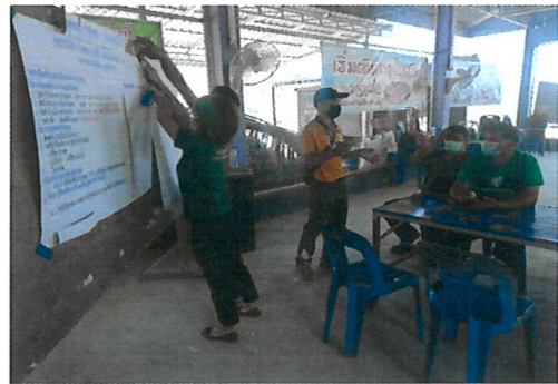
ประชุมเพื่อจัดทำแบบเสนอโครงการบริหารจัดการพื้นที่โดยการสนับสนุนจากภาครัฐ (แบบ อนุ.บ.๑)