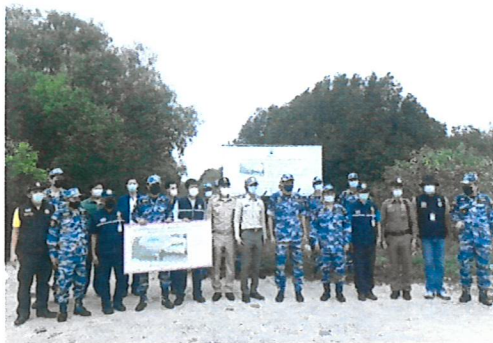
ตรวจสอบพื้นที่เป้าหมายตามแผนปฏิบัติการเพิ่มและฟื้นฟูพื้นที่ป่าชายเลน (ทางคืนผืนป่าชายเลน) ท้องที่ หมู่ที่ ๔ ตำบลบางปูใหม่ อำเภอเมืองสมุทรปราการ จังหวัดสมุทรปราการ