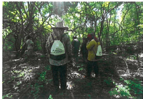
สำรวจพื้นที่ขอจัดตั้งป่าชุมชน