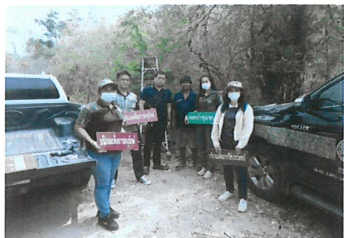
จัดทำแนวเขตและแบ่งบริเวณใช้ประโยชน์ป่าชุมชน และติดตั้งป้ายแนวเขตป่าชุมชน