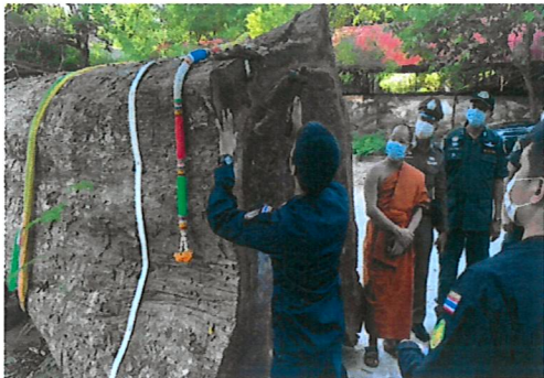
ตรวจสอบไม้ตะเคียนสามพอนท่อน ณ วัดสามพราน ตำบลสามพราน อำเภอสองพี่น้อง จังหวัดนครปฐม