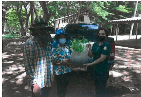
ประชาสัมพันธ์โครงการ รับเกษตรกรเข้าร่วมโครงการ และแจกกล้าไม้ผู้เข้าร่วมโครงการ