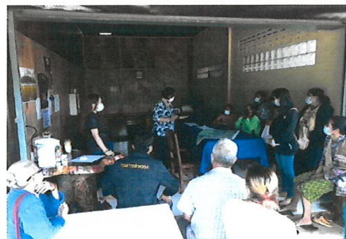
เข้าปฏิบัติงานตรวจสอบทบทวนข้อมูลการถือครองที่ดิน ในพื้นที่บ้านทุ่งนางครวญ อำเภอทองผาภูมิ จังหวัดกาญจนบุรี