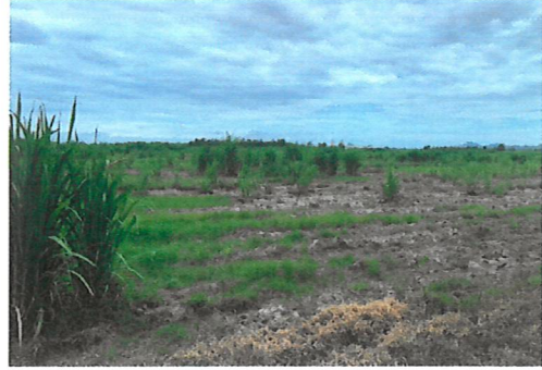
ตรวจสอบพื้นที่โรงเรียนบริเวณป่าสงวนแห่งชาติป่าสาม ตำบลเขาขลุ่ย อำเภอบ้านโป่ง จังหวัดราชบุรี