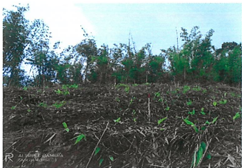
การปลูกและขนกล้าไม้