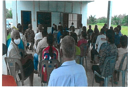
ประสานผู้นำท้องถิ่น จัดประชุมราษฎรผู้ครอบครองที่ดินตามรายชื่อ ตรวจสอบทบทวนข้อมูลผู้ครอบครองที่ดินเดิม ให้เป็นข้อมูลปัจจุบัน