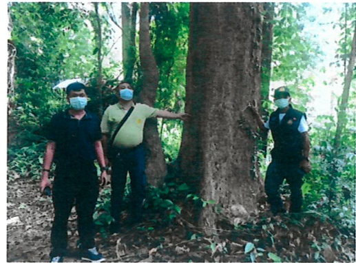
สำรวจพื้นที่เพื่อสนับสนุนงบประมาณอุดหนุน