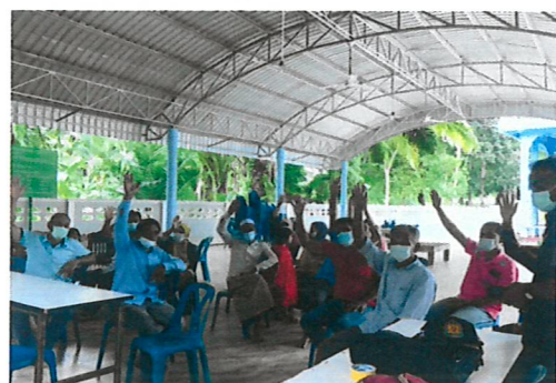
สร้างความรู้ความเข้าใจให้คำแนะนำแก่หมู่บ้าน เป้าหมายในการดำเนินกิจกรรมส่งเสริมการจัดการป่าชุมชน