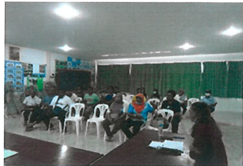
ดำเนินงานโครงการเครือข่ายชุมชนพื้นฟูป่า (คชป.) เครือข่ายชุมชนบ้านไสยวน หมู่ที่ ๗ ตำบลราไวย์ อำเภอเมืองภูเก็ต จังหวัดภูเก็ต