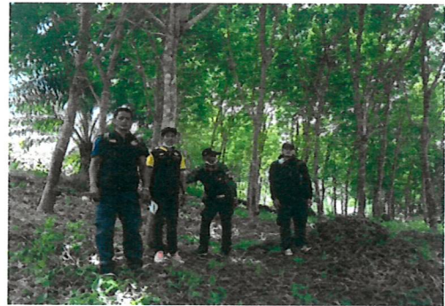
วันที่ ๑๔ มิถุนายน ๒๕๖๔ คณะเจ้าหน้าที่ของชุดปฏิบัติการพิเศษป่าไม้ สจป.ที่ ๑๒ สาขากระบี่ ร่วมชุดปฏิบัติการพิเศษป่าไม้กระบี่ หน่วยป้องกันรักษาป่าที่ กบ.๑ (เหนือคลอง) และศป.๔ (ภาคใต้) เข้าตรวจสอบพื้นที่ตามการร้องเรียนทางโทรศัพท์ว่ามีกลุ่มนายทุนเข้าบุกรุกพื้นที่ท้องที่บ้านหน้าเขา หมู่ที่ ๘ ตำบลหน้าเขา อำเภอลำพูน จังหวัดกระบี่ จำนวน ๙๙ - ๒ - ๕๑ ไร่