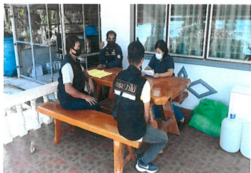
เจ้าหน้าที่ดำเนินการเผยแพร่ประชาสัมพันธ์ประกาศการป้องกันและควบคุมไฟป่าให้กับหน่วยงานราชการและชุมชน