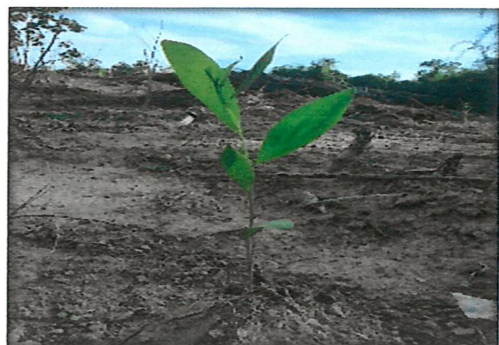
ดำเนินงานปลูกป่าทั่วไป กิจกรรมฟื้นฟูป่าเพื่อเพิ่มพื้นที่สีเขียว ป่าสงวนแห่งชาติป่าเขาช่องเสียด ป่าเขากลม และป่าเขาช่องบางเหียง บ้านหน้าช่อง หมู่ที่ ๑ ตำบลสินปุน อำเภอเขาพนม จังหวัดกระบี่ จำนวน ๕ แปลง เนื้อที่รวม ๑,๐๐๐ ไร่