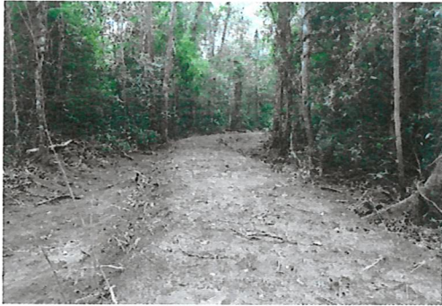
ติดป้ายกิจกรรมการจัดการป่าชุมชน และแบ่งบริเวณการใช้ประโยชน์ป่าชุมชน