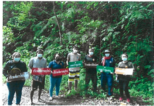
ติดป้ายกิจกรรมการจัดทำแนวเขตและแบ่งบริเวณการใช้ประโยชน์ป่าชุมชน