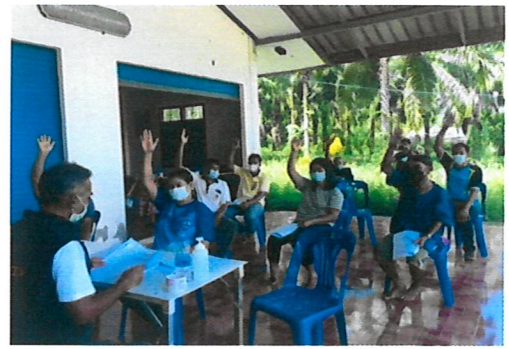
ประชุมสร้างความรู้ ให้คำแนะนำ แก่หมู่บ้านเป้าหมายในการดำเนินกิจกรรม ฯ