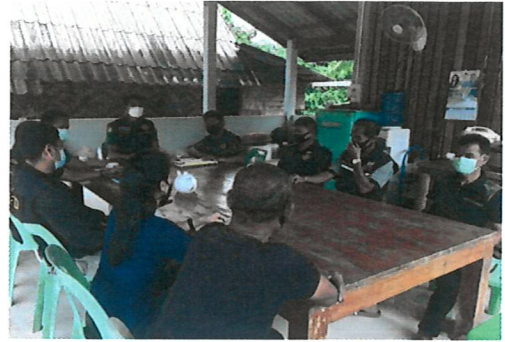
ผู้อำนวยการส่วนป้องกันรักษาป่าและควบคุมไฟป่า ตรวจสอบติดตามและประเมินผลการปฏิบัติงานตามแผนปฏิบัติงานป้องกันไฟป่าและควบคุมหมอกควัน หน่วยป้องกันรักษาป่าที่ พง.๓ (ตะกั่วป่า)