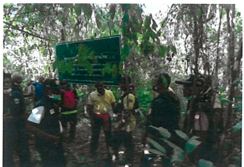
วันที่ ๒๐ เมษายน ๒๕๖๔ เจ้าหน้าที่ชุดปฏิบัติการพิเศษป่าไม้กระบี่ เข้าตรวจสอบพื้นที่ป่าชุมชนบ้านในยวนไทย ตำบลเขาใหญ่ อำเภอลำพูน จังหวัดกระบี่ พื้นที่จำนวน ๑ - ๐ - ๗๗ ไร่