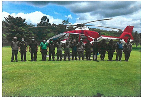
บินตรวจสอบสภาพป่า ร่วมกับหน่วยงานที่เกี่ยวข้อง