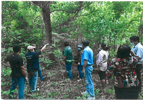
การสำรวจพื้นที่เพื่อจัดตั้งป่าชุมชน จังหวัดระยอง