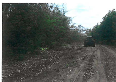
จัดทำแนวกันไฟ