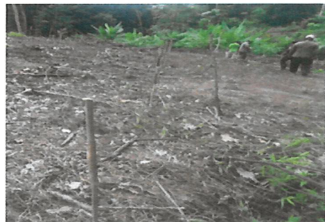
การทำหลักและปักหมยแนว