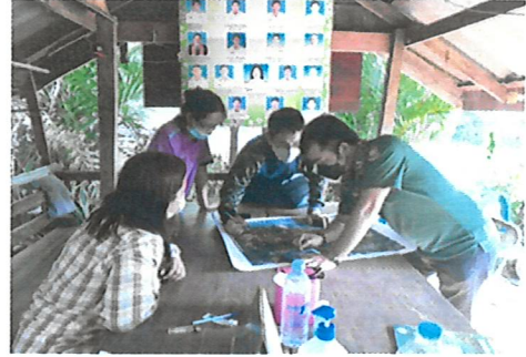
ติดต่อประสานงาน ผู้นำชุมชนและราษฎรในพื้นที่