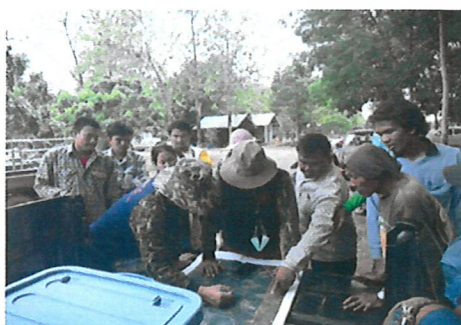
ติดต่อประสานงานผู้นำชุมชน ประชุมชี้แจงราษฎร