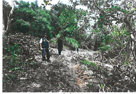
ตรวจสอบพื้นที่ตามที่ได้รับทราบการประสานงานจากหน่วยงานที่เกี่ยวข้อง