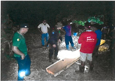
จับกุมดำเนินคดีในพื้นที่รับผิดชอบ