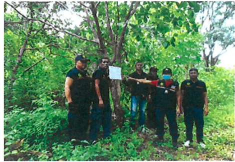
ดำเนินการตรวจยึดพื้นที่ป่าที่ถูกบุกรุกทำลาย