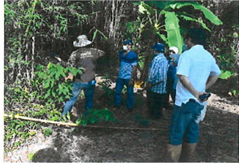
ติดต่อประสานงานผู้นำชุมชนและราษฎรในพื้นที่