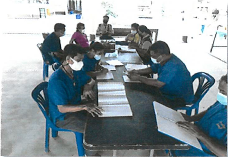
กิจกรรมการจัดตั้งป่าชุมชน จังหวัดจันทบุรี