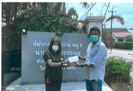
การมอบเช็คให้ชุมชน