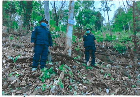
ลาดตระเวน ตรวจสอบพื้นที่