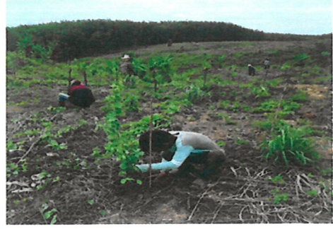
การขนส่งกล้าไม้ และปลูก