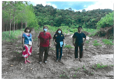
การสำรวจพื้นที่เพื่อจัดตั้งป่าชุมชน จังหวัดชลบุรี