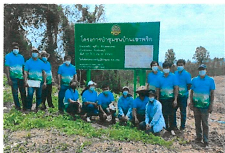
กิจกรรมด้านการบำรุงและฟื้นฟูป่าชุมชน