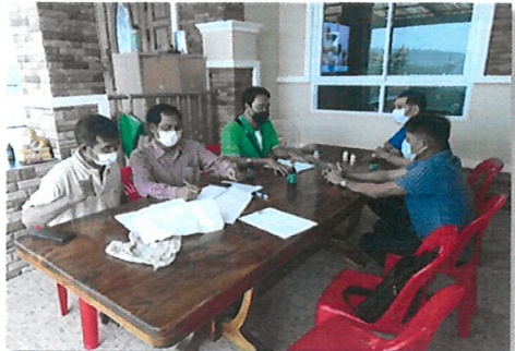
กิจกรรมการส่งเสริมการจัดทำแผนจัดการป่าชุมชน จังหวัดตราด