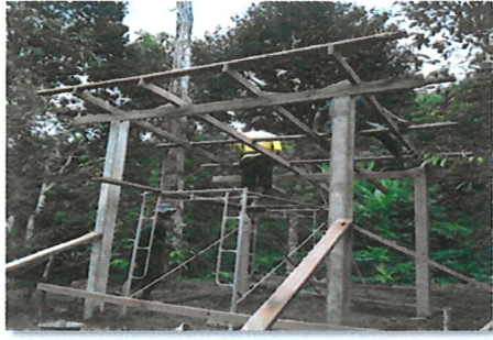
กิจกรรมด้านการดูแลรักษาป่าชุมชน สร้างที่พักสายตรวจ