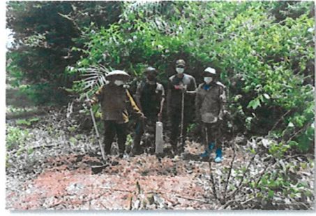
การปักหลักแนวเขตป่าชุมชน