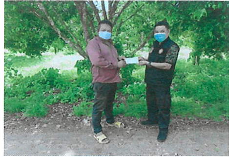
หน่วยป้องกันและพัฒนาป่าไม้มอบเงินอุดหนุนให้ เครือข่ายความร่วมมือในการป้องกันและควบคุมไฟป่า