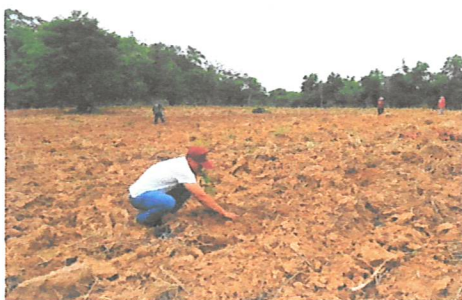
ปลูกและขนส่งกล้าไม้