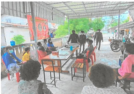
ประชุมชี้แจงราษฎร สร้างการมีส่วนร่วม