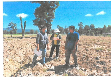
ติดตามผลการดำเนินงาน