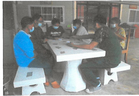
กิจกรรมการจัดทำแนวเขตและแบ่งบริเวณการใช้ประโยชน์ป่าชุมชน