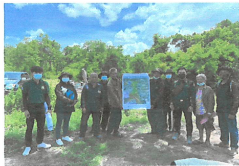
กิจกรรมโครงการจัดทำแผนการบริหารจัดการทรัพยากร ที่ดินและป่าไม้ระดับพื้นที่