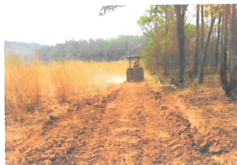
ทำทางตรวจการ