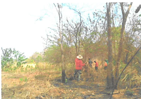
เก็บ ริม สุม