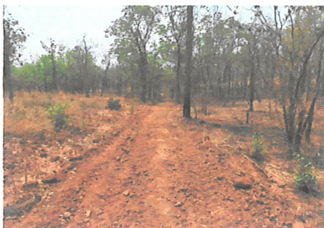
ทำแนวกันไฟ