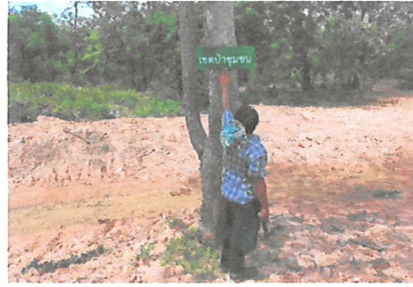
กิจกรรมการจัดตั้งป่าชุมชน