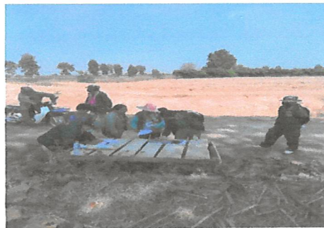
สำรวจตรวจสอบจัดทำข้อมูลขอบเขตพื้นที่