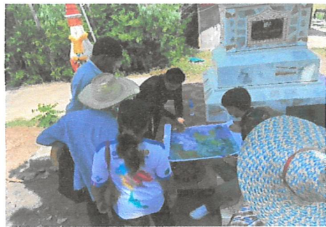
สำรวจฐานข้อมูลการถือครองที่ดินของราษฎร