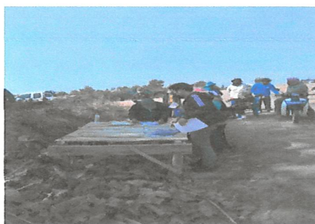
ตรวจสอบทบทวนข้อมูลผู้ครอบครองที่ดินทำกินเดิม กิจกรรม ตรวจสอบพื้นที่ป่าสงวนแห่งชาติ เพื่อการจัดหาที่ดินทำกินให้ชุมชน