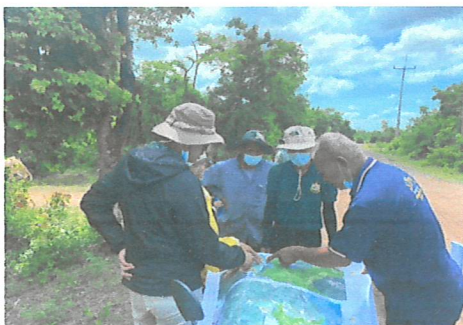
สำรวจฐานข้อมูลการถือครองที่ดินของราษฎร