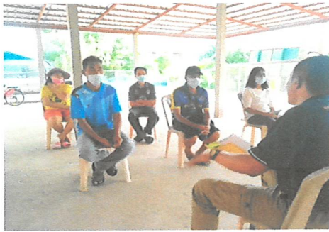
ประชาสัมพันธ์โครงการและรับสมัครเกษตรกรเข้าร่วมโครงการ