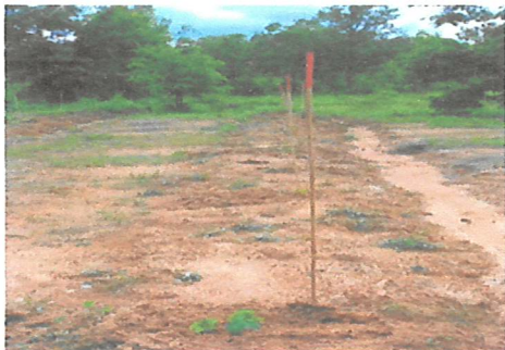
ทำหลักและปักหมยแนว