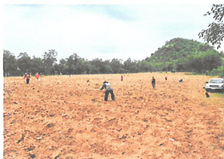
ทำหลักและปักหมยแนวเขต