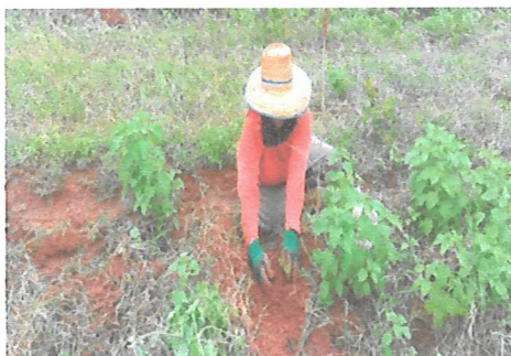
ขุดหลุมและปลูก