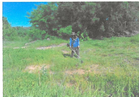
ฉายรังสีพืช