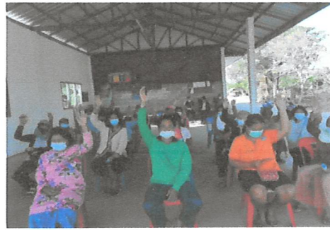
กิจกรรมการส่งเสริมการจัดทำแผนจัดการป่าชุมชน