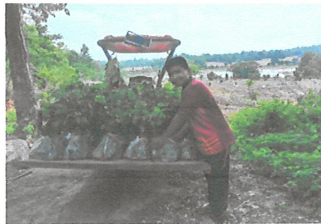
ขนกล้าไม้