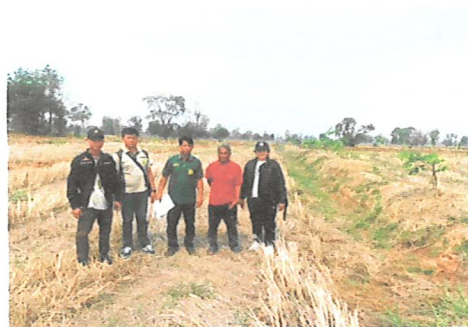
สำรวจพื้นที่และให้ความรู้ทางด้านวิชาการและการบริหารจัดการสวนป่าแก่เกษตรกร