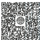
แผนและแบบรายงานผล