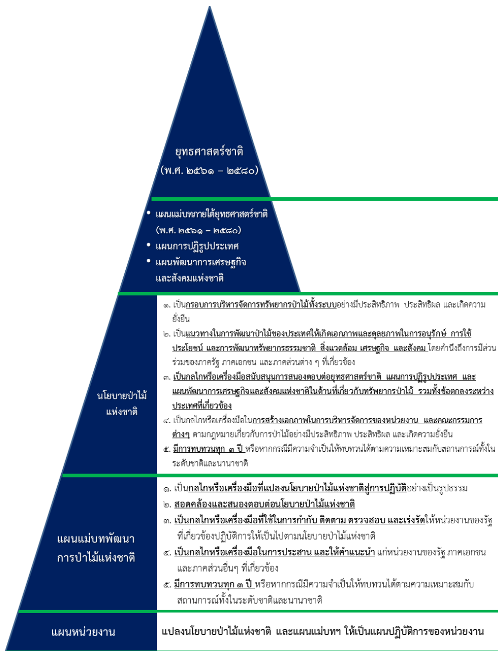
ภาพที่ ๒ ลำดับชั้นของนโยบายป่าไม้แห่งชาติ แผนแม่บทพัฒนาการป่าไม้แห่งชาติ และความเชื่อมโยงกับหน่วยงานของรัฐ

นโยบายป่าไม้แห่งชาติเป็นกรอบการบริหารจัดการทรัพยากรป่าไม้ทั้งระบบอย่างมีประสิทธิภาพ ประสิทธิผล และเกิดความยั่งยืน และเป็นแนวทางในการพัฒนาป่าไม้ของประเทศให้เกิดเอกภาพและดุลยภาพ ในการอนุรักษ์ การใช้ประโยชน์ และการพัฒนาทรัพยากรธรรมชาติ สิ่งแวดล้อม เศรษฐกิจ และสังคม โดยคำนึงถึงการมีส่วนร่วมของภาครัฐ ภาคเอกชน และภาคส่วนต่าง ๆ ที่เกี่ยวข้อง โดยมีลำดับชั้นของนโยบายป่าไม้แห่งชาติและความเชื่อมโยงกับหน่วยงานของรัฐ ดังแสดงในภาพที่ ๒