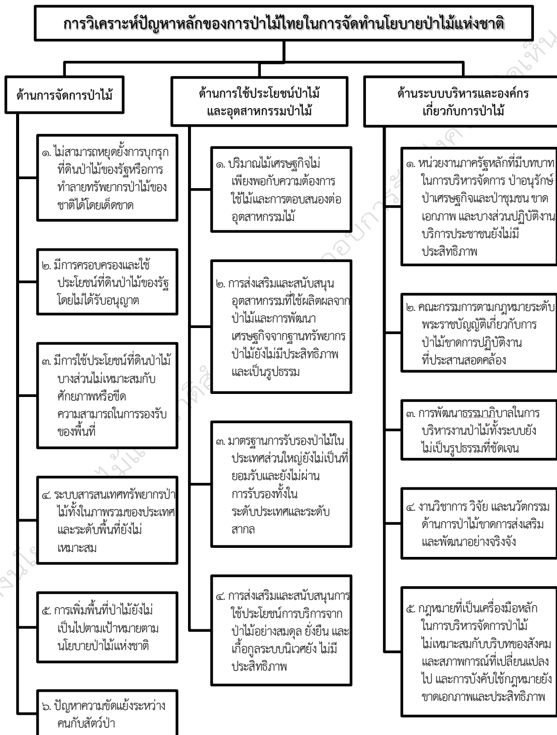
ภาพที่ ๓ การวิเคราะห์ปัญหาหลักของการป่าไม้ไทยในการจัดทำนโยบายป่าไม้แห่งชาติ

การวิเคราะห์สถานการณ์การป่าไม้ไทยในการจัดทำนโยบายป่าไม้แห่งชาติ ได้ดำเนินการวิเคราะห์ทั้งสถานการณ์ ปัญหา โอกาส และ สถานการณ์และแนวโน้มภายนอกที่กระทบต่อการป่าไม้ไทย โดยในส่วนของ การวิเคราะห์ปัญหาหลักที่ต้องคำนึงถึงในการจัดทำนโยบายป่าไม้แห่งชาติ แสดงดังภาพที่ ๓