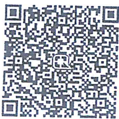
บัญชีเงินการกุศล สำนักงาน ปลัดกระทรวงสาธารณสุข

หมายเหตุ โอนเข้าบัญชี โปรดส่งหลักฐาน/สำเนาใบรับฝากเงินไปยัง กลุ่มบริหารการเงิน กองบริหารการคลัง สำนักงานปลัดกระทรวงสาธารณสุข โทร.๐ ๒๕๙๐ ๑๒๗๖ โทรสาร ๐ ๒๕๙๑ ๘๕๔๓ หรือ ทาง QR Code