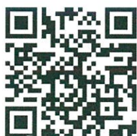
รายงานผลรายสัปดาห์ พ.ศ. ๒๕๖๖ ไปพลางก่อน

ราชการแทนผู้อำนวยการสำนักส่งเสริมการปลูกป่า