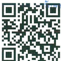
แบบฟอร์มรายงาน