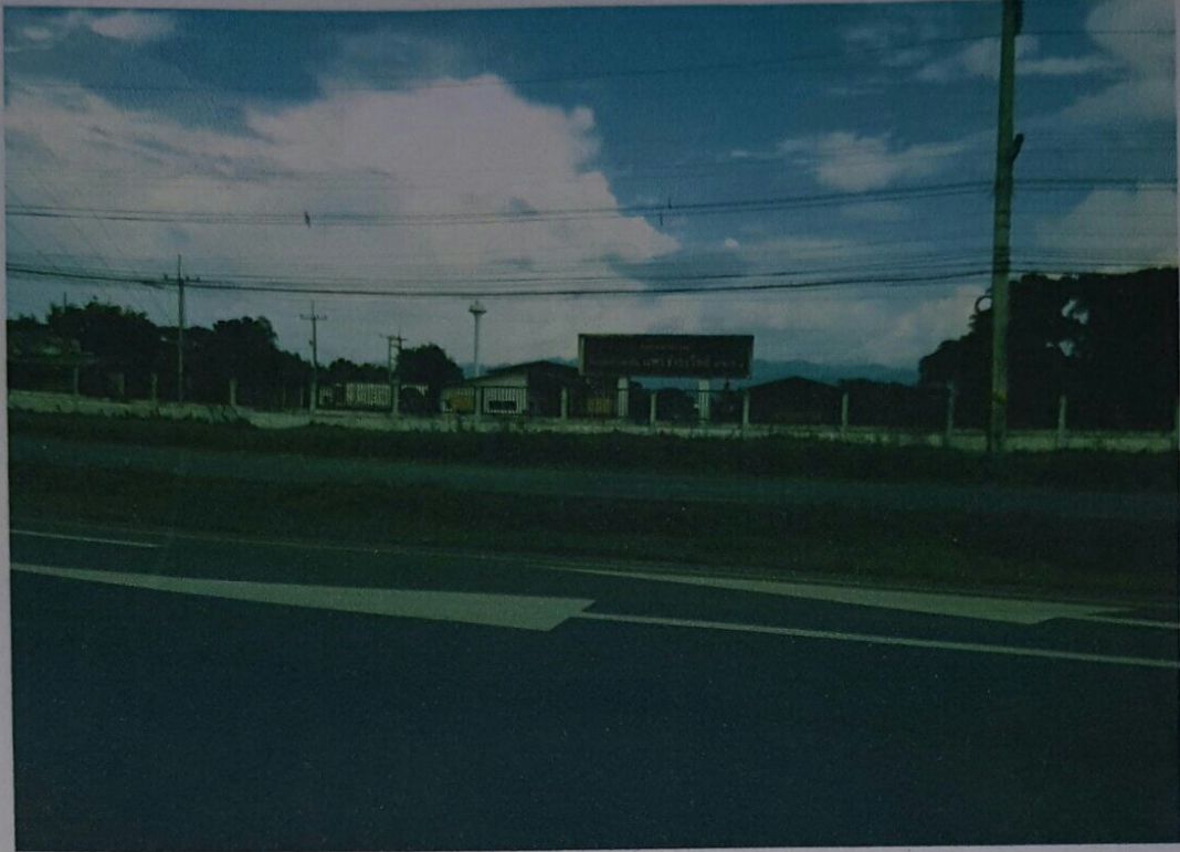
ภาพถ่าย พื้นที่แปลงปลูกป่า

ผู้ขอรับกล้าไม้ ชื่อ หจก.แพร่ธำรงวิทย์ สถานที่ปลูก ม.๑๒ ต.เหมืองหม้อ อ.เมือง จ.แพร่ จำนวนกล้าไม้ที่ขอ ๑,๕๐๐ กล้า พิกัด UTM ๒๐๐๕๘๐๘ , 47Q 062 2370 หน่วยงานแจกจ่ายกล้าไม้ ศูนย์เพาะชำกล้าไม้แพร่ ปีงบประมาณ พ.ศ. ๒๕๕๙