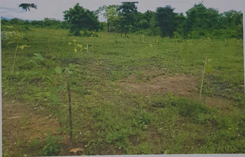
ภาพถ่าย พื้นที่แปลงปลูกป่า