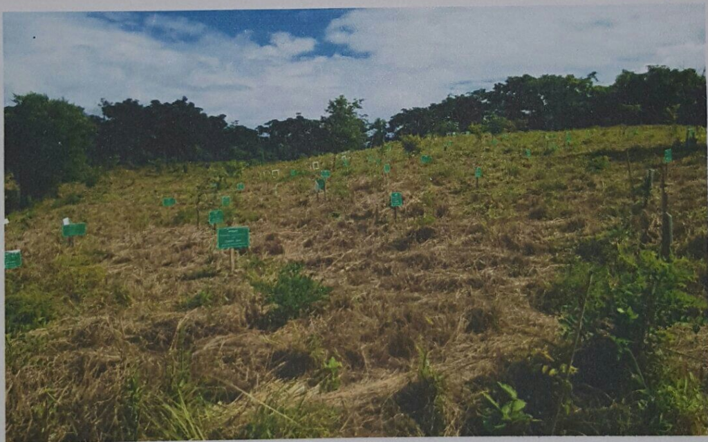
ภาพถ่าย พื้นที่แปลงปลูกป่า