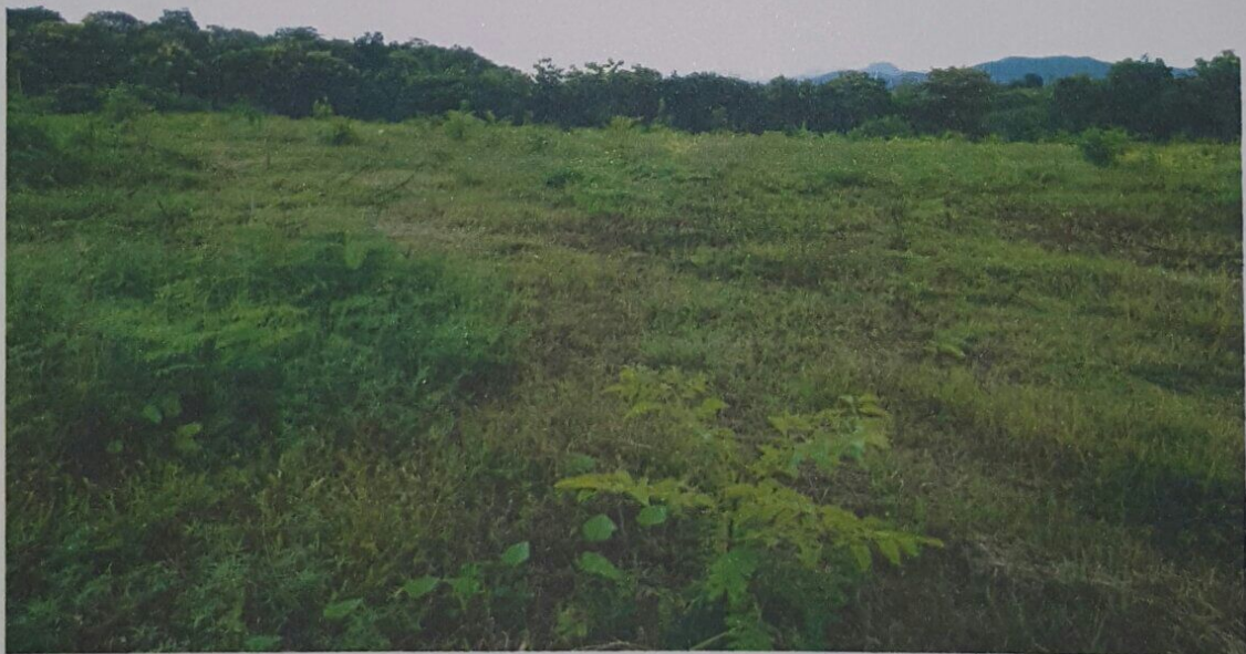
ภาพถ่าย พื้นที่แปลงปลูกป่า