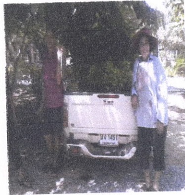
ขอรับกล้าไม้

ค่าพิกัดพื้นที่ปลูก ระบบ UTM 47 P 0631999 , 1501325