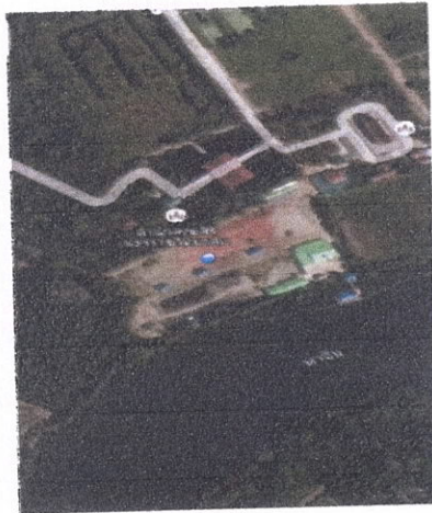
เจ้าหน้าที่ติดตามและประเมินผลการปลูก

ค่าพิกัดพื้นที่ปลูก ระบบ UTM 47 P 0631473 , 1507254