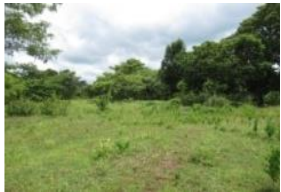
ภาพแสดงผลดำเนินการกิจกรรมปลูกป่า