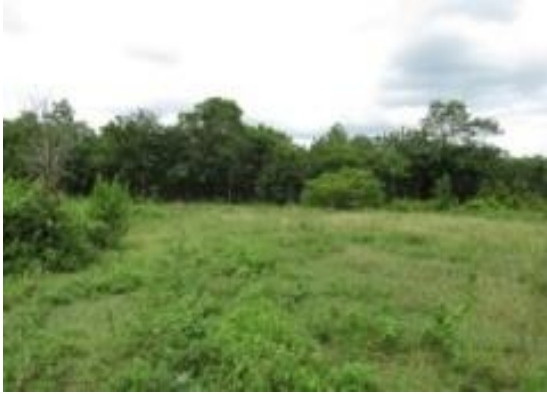
ภาพพื้นที่ก่อนดำเนินการ