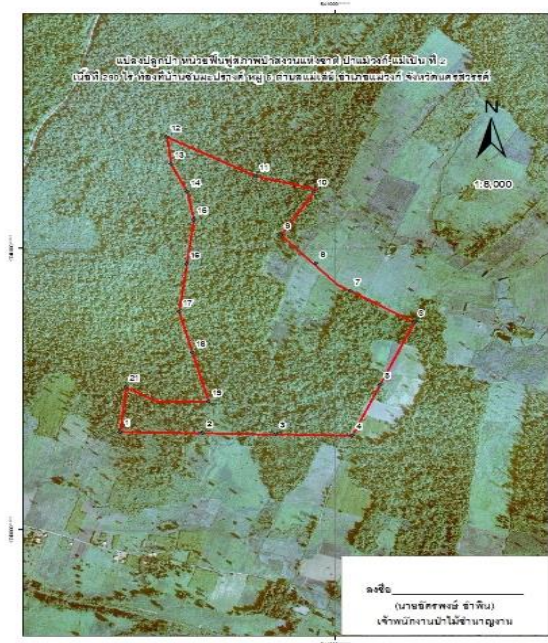
ภาพถ่ายทางอากาศ