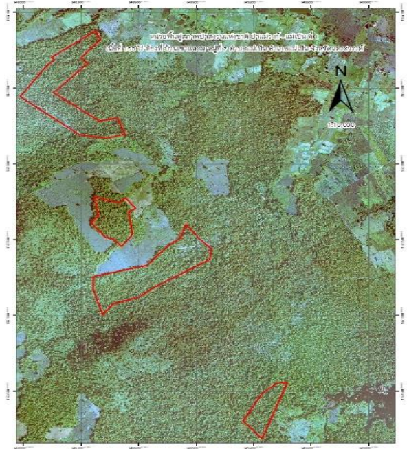
ภาพถ่ายทางอากาศ