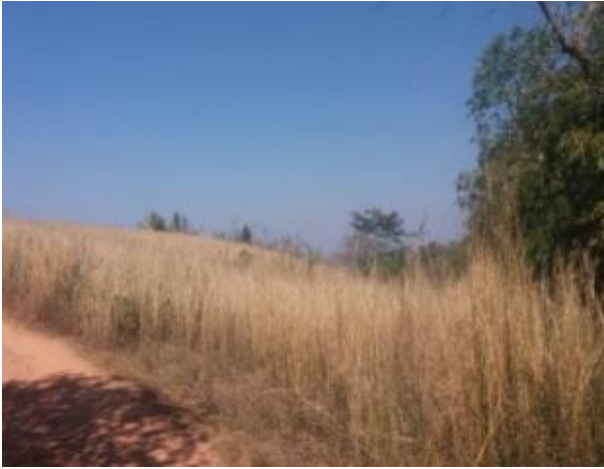
ภาพพื้นที่ก่อนดำเนินการ