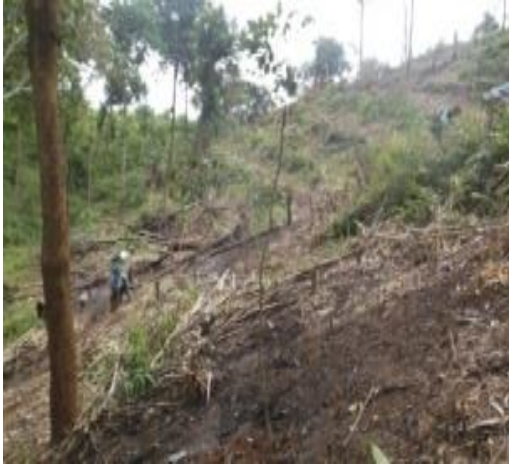
ภาพพื้นที่ก่อนดำเนินการ