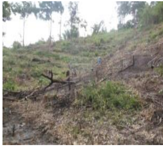
พื้นที่ดำเนินการกิจกรรมปลูกป่า