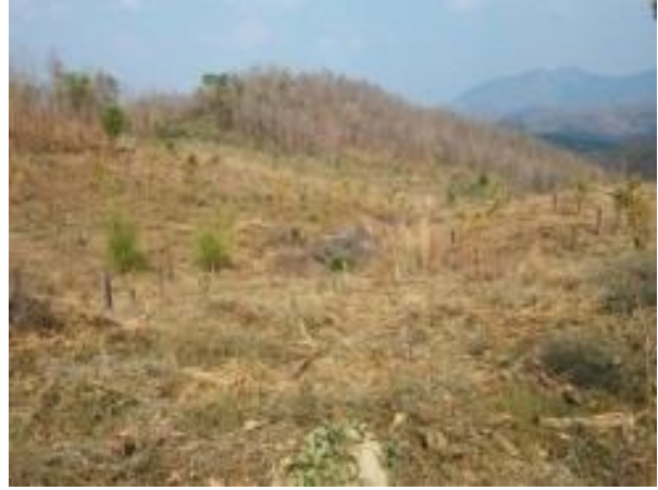
พื้นที่ดำเนินการกิจกรรมปลูกป่า