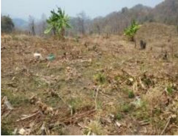
ภาพพื้นที่ก่อนดำเนินการ