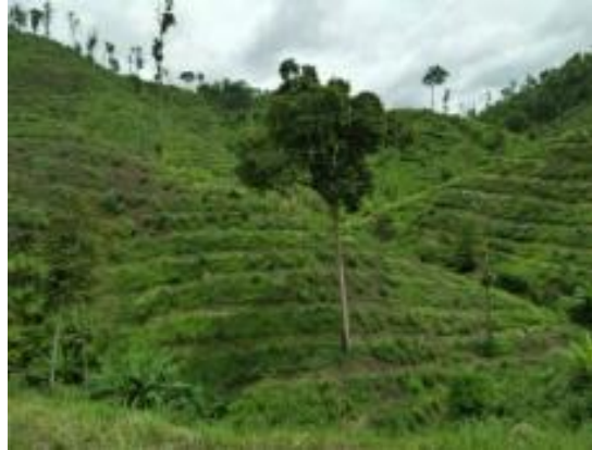
พื้นที่ดำเนินการกิจกรรมปลูกป่า