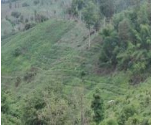
ภาพพื้นที่ก่อนดำเนินการ