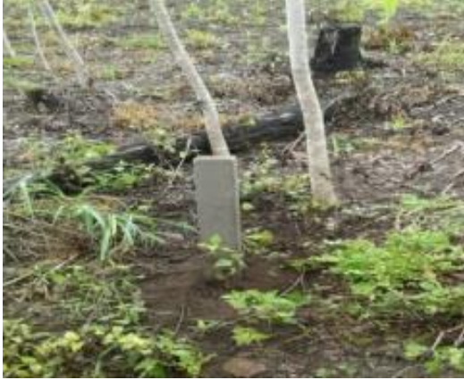
ภาพพื้นที่ก่อนดำเนินการ