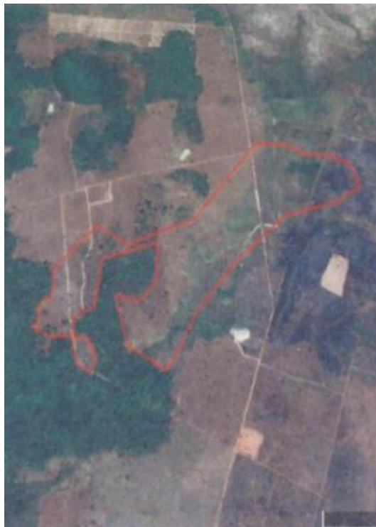
ภาพถ่ายทางอากาศ