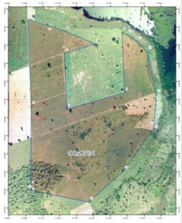
ภาพถ่ายทางอากาศ