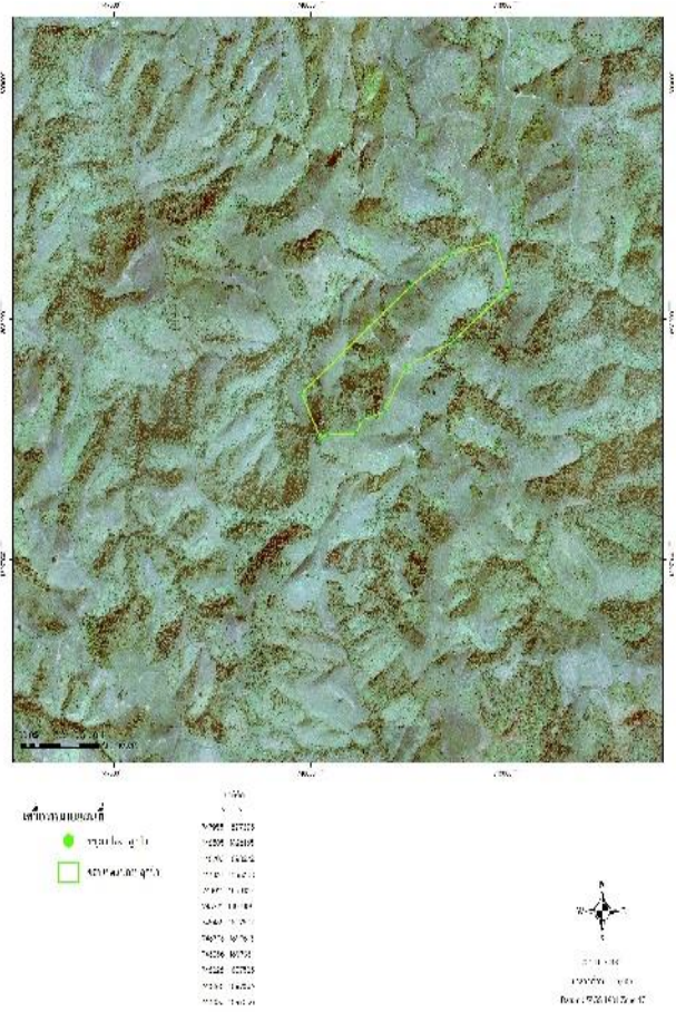
ภาพถ่ายทางอากาศ