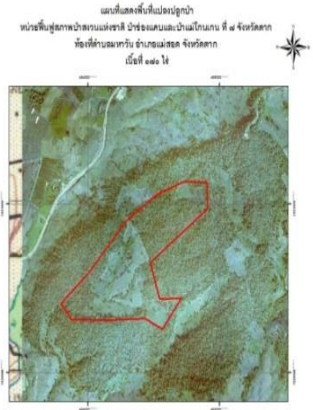
ค่าพิกัดแปลงปลูกป่า