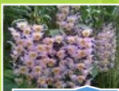
กัล้วยไม้