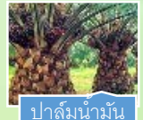
ปาล์มน้ำมัน