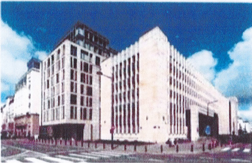
อาคารศาลปกครองสูงสุดในเมืองวอร์ซอ

ศาลในประเทศโปแลนด์ประกอบไปด้วย ศาลฎีกา (ศาลยุติธรรม) ศาลปกครองและศาลทหาร ในส่วนของคณะกรรมการวินิจฉัยชี้ขาดข้อพิพาท (Tribunals) นั้น จะมีคณะตุลาการรัฐธรรมนูญ (Constitutional Tribunal) และคณะกรรมการชี้ขาดข้อพิพาทแห่งรัฐ (Tribunal of the State)