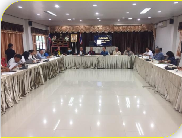
ภาพแสดงการการปฏิบัติงาน