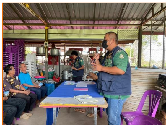
ภาพแสดงการปฏิบัติงาน เจ้าหน้าที่ลงพื้นที่ ประชาคม และประชาสัมพันธ์กิจกรรมอื่นๆ ให้กับ ชุมชนบ้านนาสวรรค์ ต.คลองกระจิง อ.ศรีเทพ จ.เพชรบูรณ์