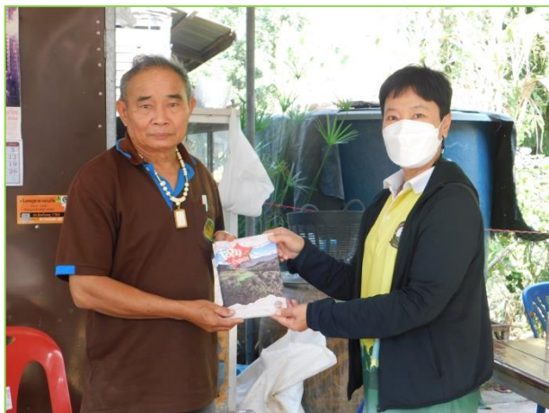
ภาพแสดงการการปฏิบัติงาน เจ้าหน้าที่ประชาสัมพันธ์ เสริมสร้างความรู้ความเข้าใจให้กับชุมชนบ้านเขาน้อย ต.ดงประคำ อ.พรหมพิราม จ.พิษณุโลก