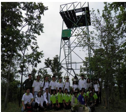
การสร้างหอดูไฟ