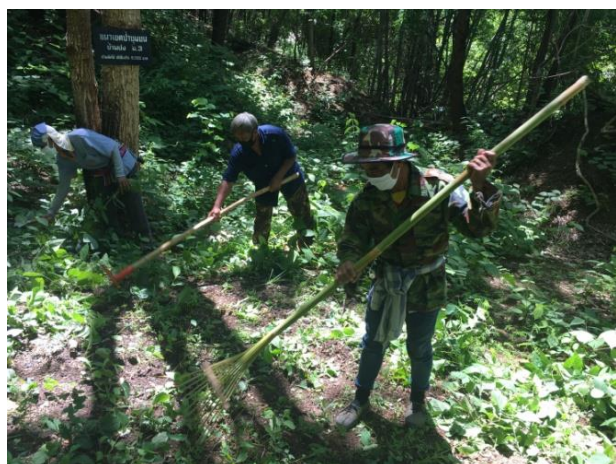
การทำแนวกันไฟ