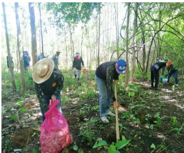
ภาพที่ ๕ การปลูกฟื้นฟูป่าในพื้นที่ป่าชุมชน

“รูปแบบการปลูกฟื้นฟูป่าชุมชน” เป็นรูปแบบผสมผสานระหว่างการปลูกป่า ๓ อย่าง ประโยชน์ ๔ อย่าง ตามแนวพระราชดำริ การปลูกป่าแบบระบบวนเกษตร และการปลูกป่าเลียนแบบธรรมชาติ ในลักษณะ ๓ ชั้นเรือนยอด โดยมีวัตถุประสงค์เพื่อการฟื้นฟูป่าชุมชน การอนุรักษ์ดิน น้ำ และความหลากหลายทางชีวภาพ และเพื่อเป็นแหล่งไม้ใช้สอย แหล่งพืชอาหาร (Food Bank) แหล่งพืชสมุนไพร สำหรับคนในชุมชนได้ใช้ประโยชน์เพื่อการบริโภคในครัวเรือน เพื่อการลดรายจ่าย เพิ่มรายได้ในครัวเรือน หรือการพัฒนาต่อยอดเพื่อสร้างเศรษฐกิจชุมชน เป็นต้น