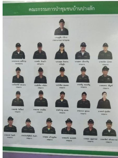
ภาพที่ ๓ ป้ายประกาศและการดำเนินกิจกรรมในพื้นที่ป่าชุมชน