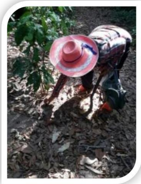
ภาพที่ ๖ ผลผลิตที่ได้จากการปลูกฟืนฟูป่าชุมชน