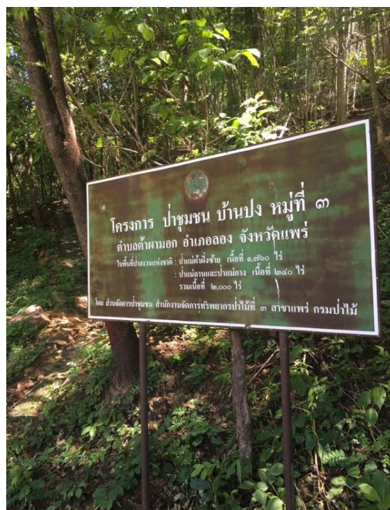
ภาพที่ ๑ ป้ายแสดงแนวเขตป่าชุมชน