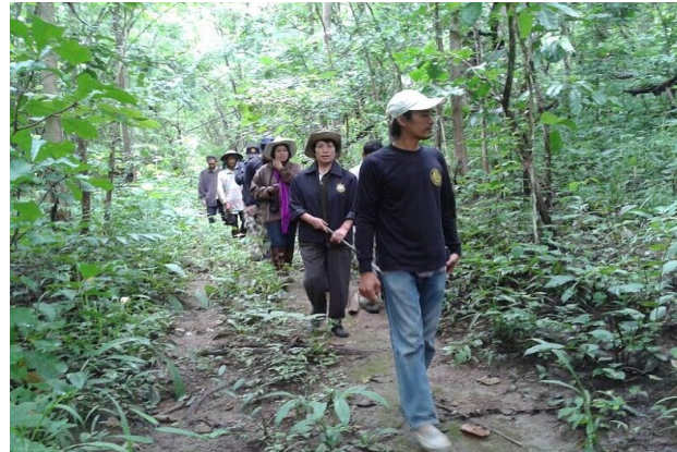
การลาดตระเวนป้องกันไฟป่า