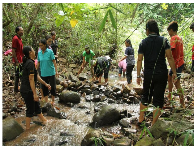
การจัดทำฝายชะลอน้ำ