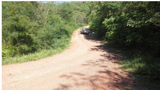
สภาพทั่วไปของป่า