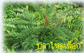
ปลาไหลเผือก