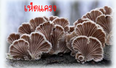
เห็ดแครง