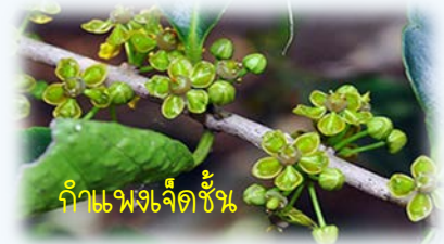
กำแพงเจ็ดชั้น