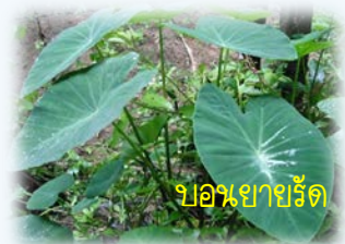
บอนยายริ้ว