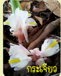
กระเจียว