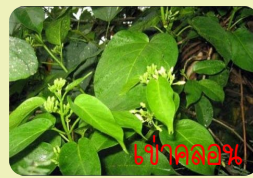
เป่าคอลอน