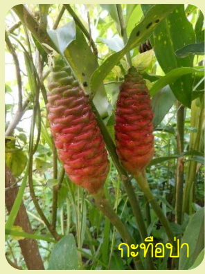
กะทือป่า