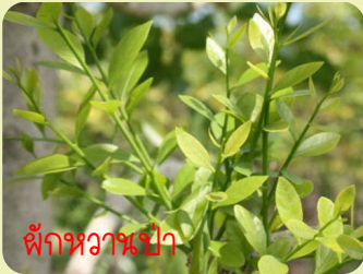
ผักหวานป่า