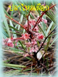
ปลาไหลเผือก