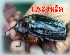
แผลงพลัด