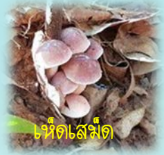
เห็ดตังไม้