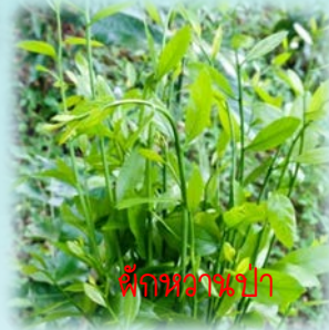
ผักหวานป่า