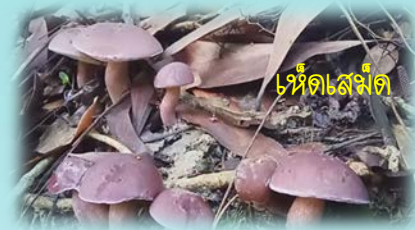
เห็ดตังไม้