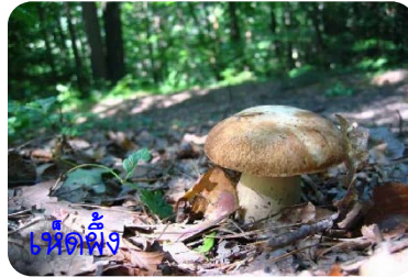
เห็ดผึ้ง