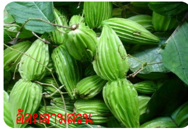
อ้อยสามสวน