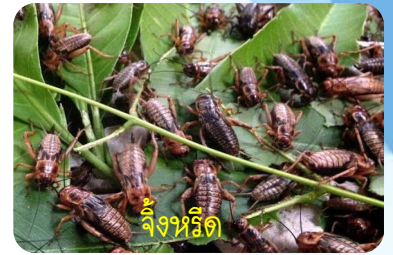
จิ้งหรีด