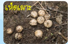
เห็ดตระใจ