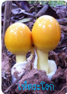
เห็ดตระใจ